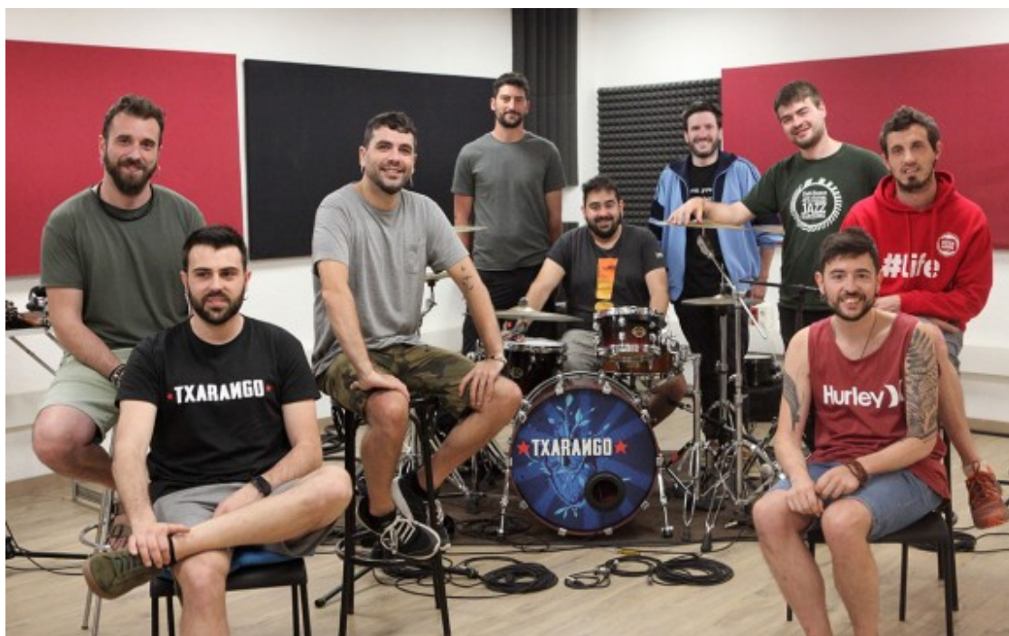
Txarango al seu local de Vic.