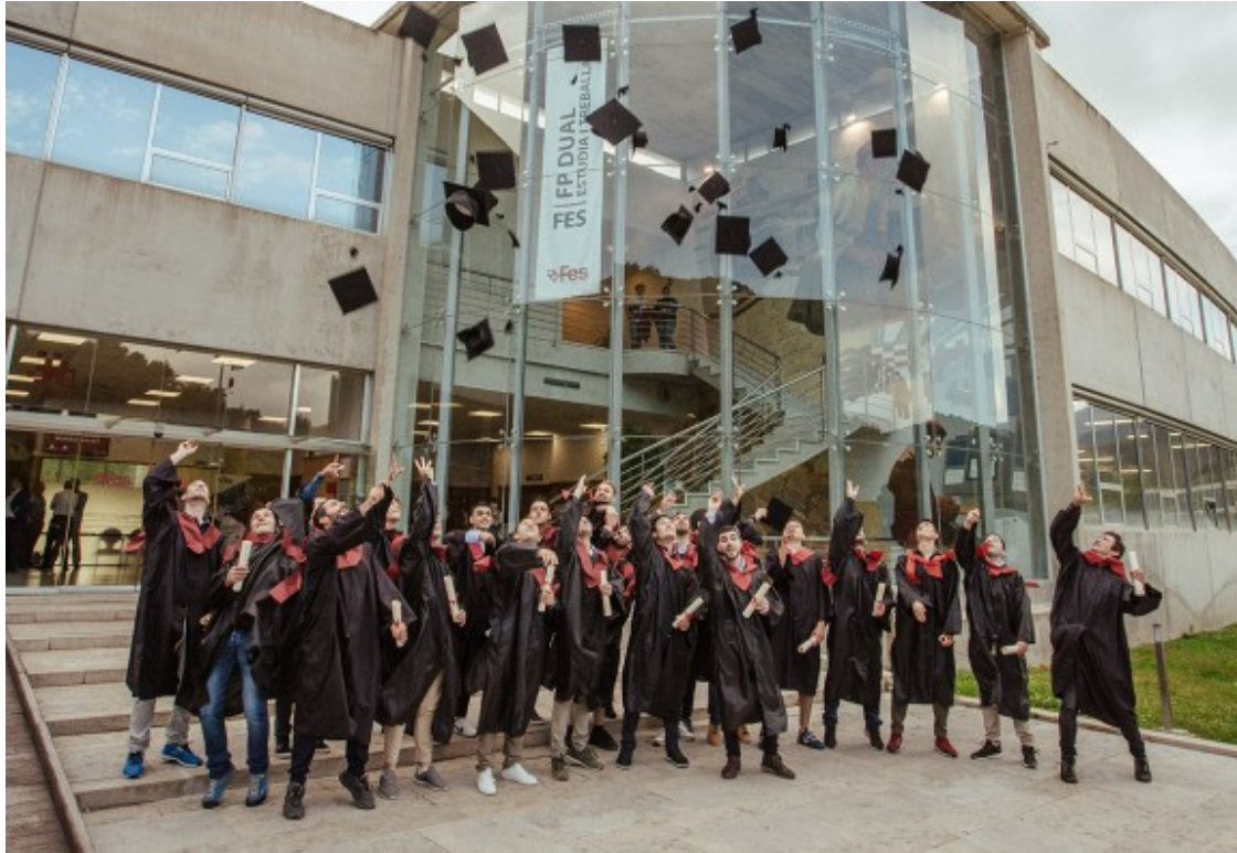
Els graduats de la FES tenen una inserció que frega el 100%.

En el cas de l'oferta de la Fundació Eduard Soler -Robòtica, Automatització i Mecatrònica ( https://www.fes.cat/formacio/cicles-formatius-grau-superior/mecatronica/ ) ; i Disseny i Programació Avançada ( https://www.fes.cat/wp-content/uploads/2019/03/robot.png ) -, la inserció laboral frega el 100%. ¿Són els alumnes els que acaben triant l'empresa on volen realitzar les pràctiques en alternança dual?, explica Casals a NacióDigital . ¿Són professionals molt demandats i ben valorats laboralment i econòmicament. Ho demostra el fet que vora el 60% dels nostres alumnes ja tenen contracte indefinit en acabar el cicle?, afegeix.