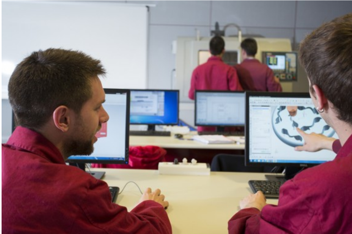
L'oferta formativa de la FES és dual i de doble titulació.

nostra filosofia?, explica Casals. La institució va néixer precisament de la voluntat de l'empresari ripollès Eduard Soler ( https://www.fes.cat/fundacio/eduard-soler/ ), cofundador de Soler & Palau, de fer extensiva la formació tecnològica entre els joves com a via de competitivitat del sector industrial.