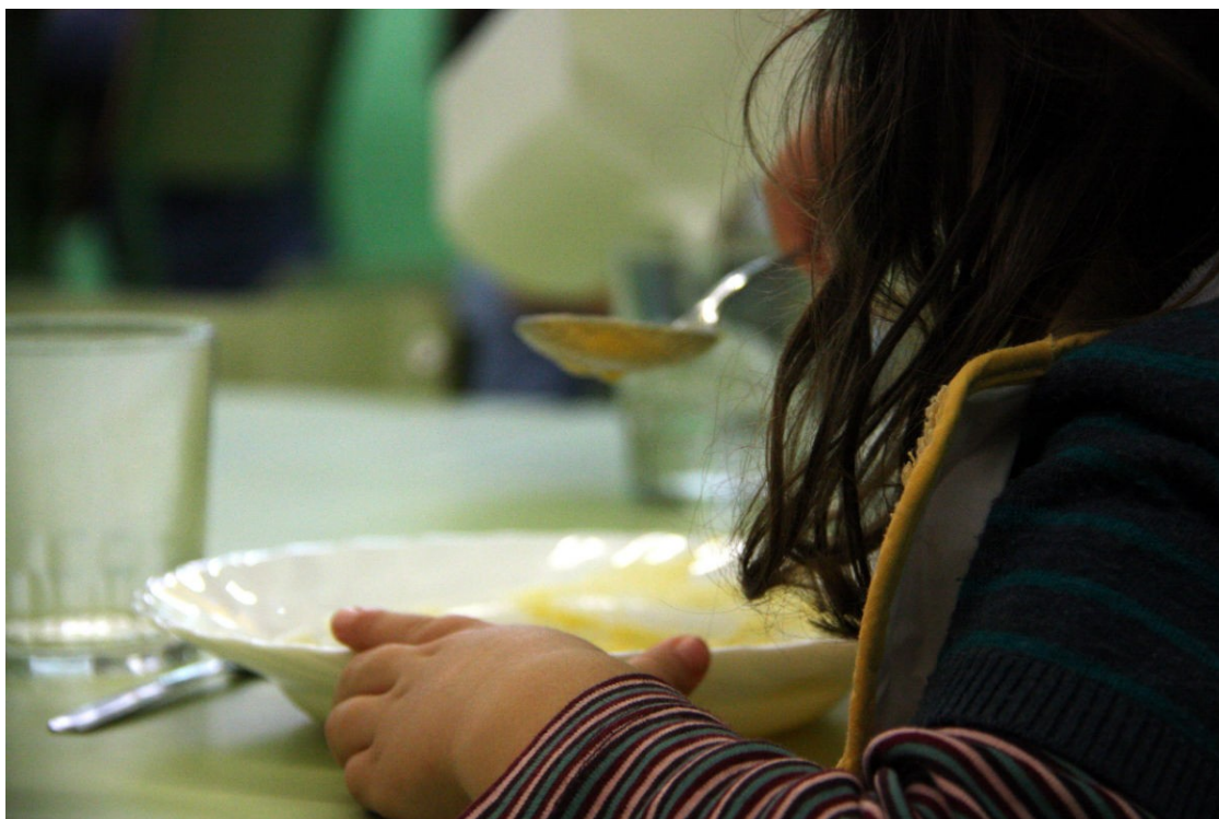
Una nena en un menjador escolar

Entitats expliquen a NacióDigital la seva proposta per flexibilitzar la jornada escolar i adaptar-la a les necessitats dels alumnes i les famílies