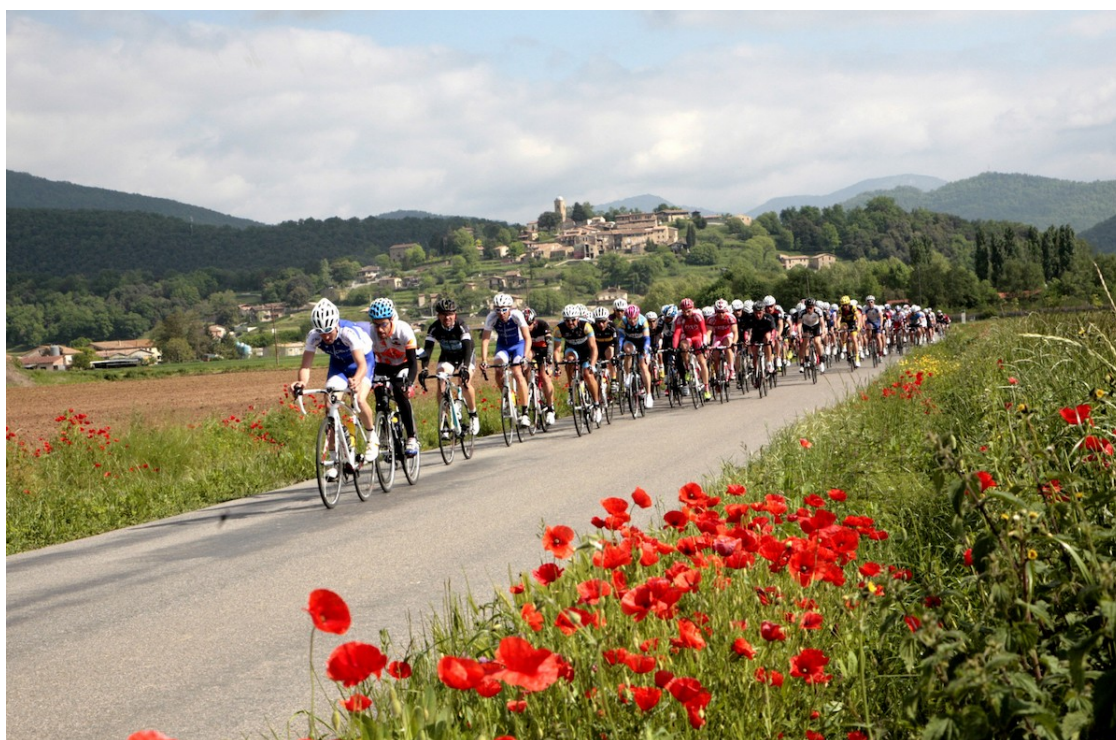
Els cicloturistes en la marxa de l'any passat a prop del Mallol

Des de fa anys l'organització limita la inscripció a la cursa per la Garrotxa, el Ripollès i Osona ?que tindrà lloc el 12 de maig? a 3.000 cicloturistes