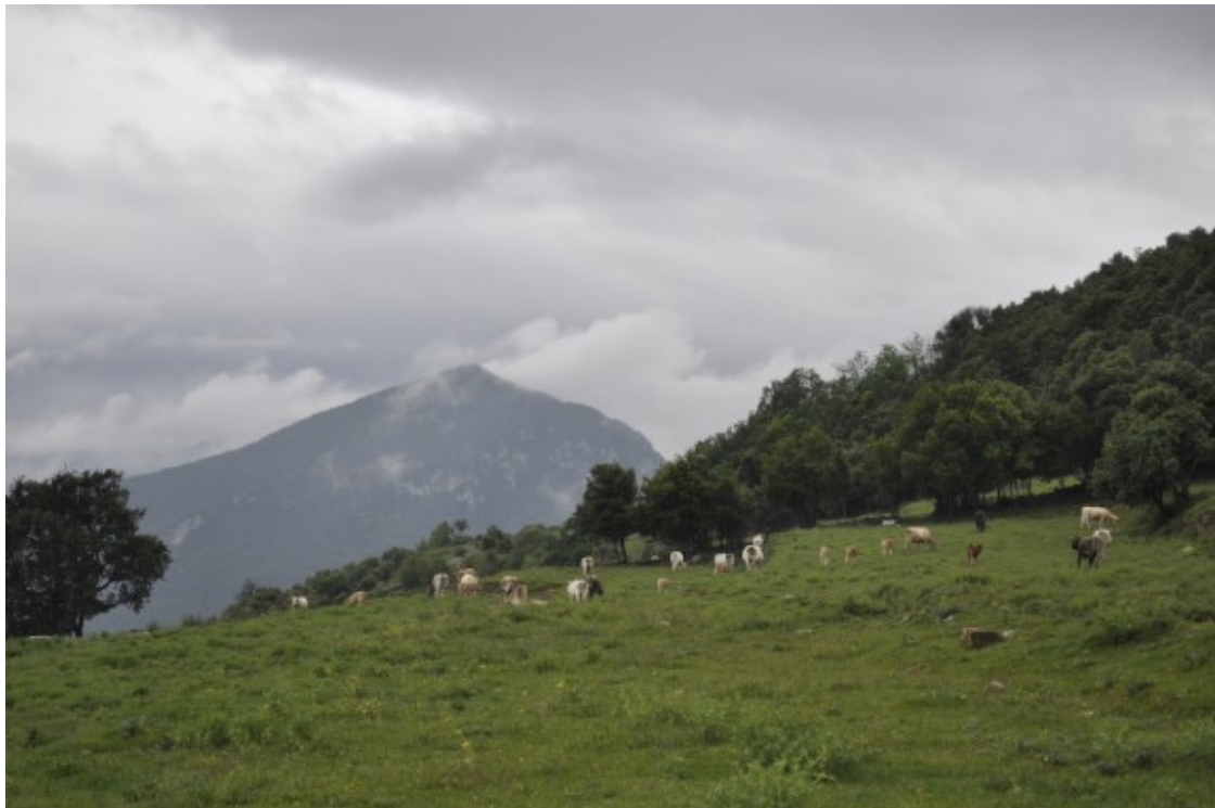
El conveni de gestió permetrà un equilibri sostenible de les activitats tradicionals.

També per afavorir la implementació del pla, a banda de la normativa, s'estableixen unes directrius d'ordenació i de gestió amb un sistema innovador d'adaptació en el temps, obrint la porta al que es coneix com a planificació adaptativa en base a un programa de seguiment. Aquestes directrius defineixen els objectius específics de gestió, les línies d'actuació prioritàries (per una gestió activa) i els criteris per a l'aplicació de la normativa mitjançant informes i autoritzacions (per una gestió preventiva).