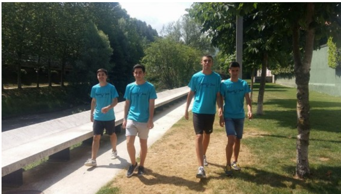
Tres dels joves treballaran a la brigada municipal i l'altre en tasques administratives

Els quatre joves seleccionats tindran un contracte de treball temporal de mitja jornada i treballaran en horari de matins de dilluns a divendres durant tot el mes de juliol. Els tres nois de la brigada municipal faran un horari de 8 a 12; mentre que el que estarà a l'oficina treballarà de 10 a 2. Els nois cobraran 545 euros bruts per la feina feta durant tot aquest mes.