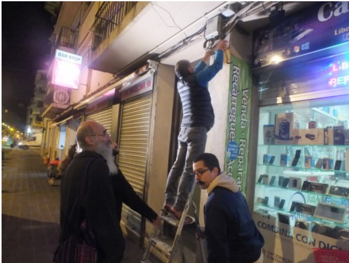
Un dels membres de la CUP retirant la placa franquista de la carretera Barcelona

Una de les dues plaques que s'han retirat estava situada al carrer del Monestir; mentre que l'altra es trobava a pocs metres de l'oficina de La Caixa. Un dels simpatitzants de la CUP s'ha enfilat a una escala i l'ha pogut despenjar de la paret utilitzant una palanca. Un cop ha acabat d'enretirar-la l'ha mostrat als mitjans de comunicació presents amb molt d'orgull. Ministerio de la Vivienda: Instituto Nacional de la Vivienda. Esta casa está acogida a los beneficios de la Ley de 15 de Julio de 1951 és el text que s'hi podia llegir, el qual anava acompanyat amb l'emblema associat al feixisme del jou i les fletxes.