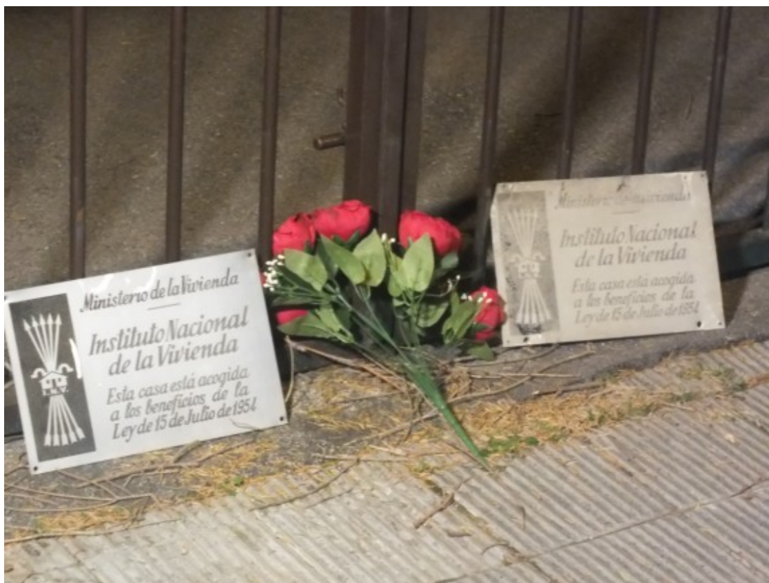
Les dues plaques franquistes amb el ram de clavells a davant l'entrada de la caserna de la Guàrdia Civil a Ripoll