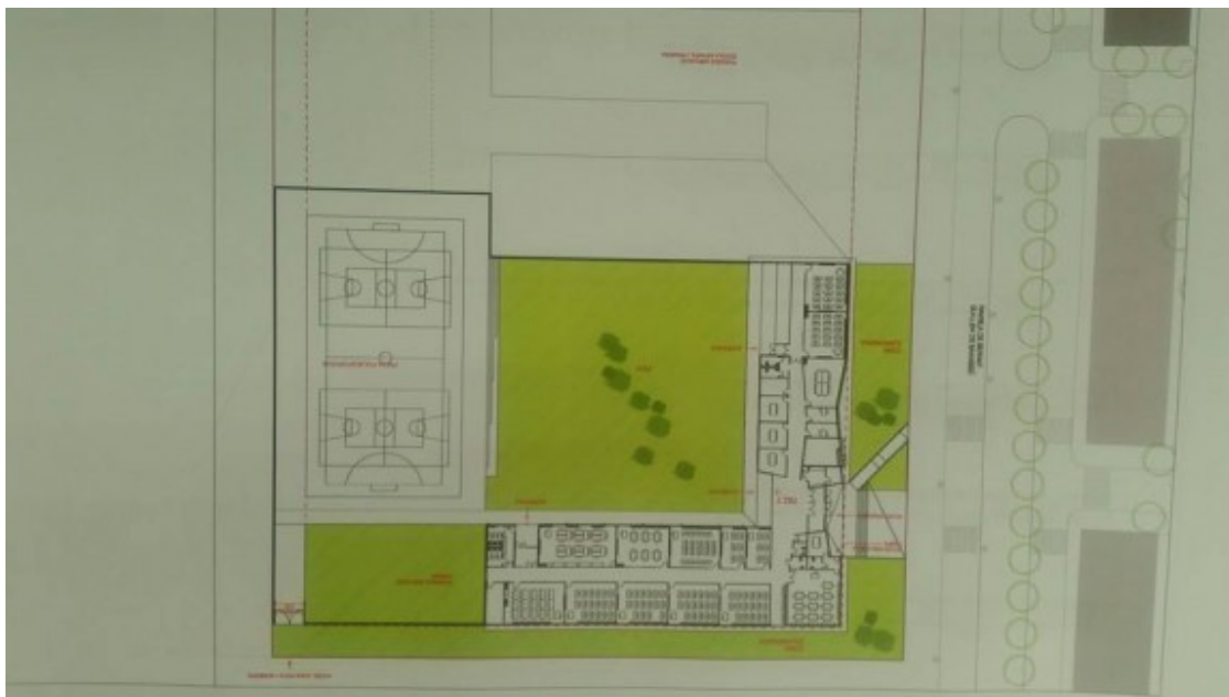
El plànol del nou Institut-Escola Mestre Andreu que s'està construint a la Coromina del Bac.

El nou edifici de secundària de l'institut-escola s'està construint als terrenys de la Coromina del Bac ( http://www.naciodigital.cat/elripolles/noticia/28501/ensenyament/licita/construccio/institut/escola/santjoan/milions ), entre el xamfrà de l'avinguda del Cubilà i la rambla Bernat Guillem de Samassó. El cost de les obres està xifrant en un total de 2,6 milions d'euros -pagat íntegrament per Ensenyament- i la previsió inicial és que els treballs s'allarguin durant onze mesos; per tant si tot va bé, s'haurien d'haver acabat just abans de l'estiu de l'any vinent. Això significa que pel curs 2018-2019 el centre estaria apunt per acollir-hi l'alumnat d'ESO. Tot i així, l'alcalde ha explicat que sinó hi hagués temps de fer el trasllat per començar-hi el curs el mes de setembre, esperarien a fer-ho pel gener.