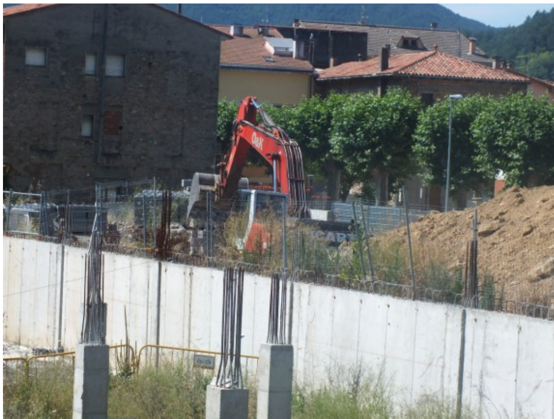
Les obres de descontaminació dels terrenys de can Ribalaigua on s'hi ha d'ubicar la nova escola de Campdevàrol ja estan en marxa

construcció del centre. Està previst que els treballs de descontaminació s'acabin a finals del mes de setembre o a principis d'octubre per tal de prendre aquesta decisió tan important pel municipi.