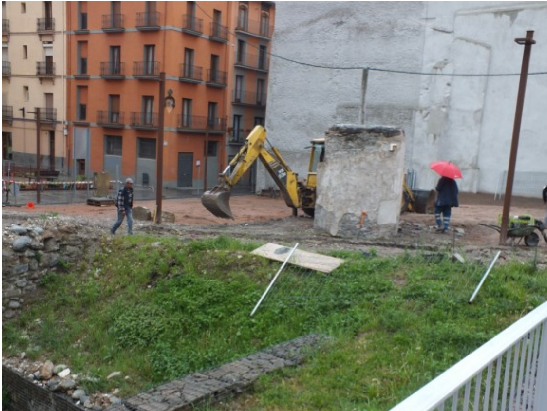
Els obrers treballant a la zona on la muralla queda al descobert