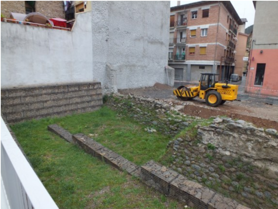
El jaciment de les muralles de Ripoll, al costat de la plaça Capranica, on s'hi estan fent les obres de conservació