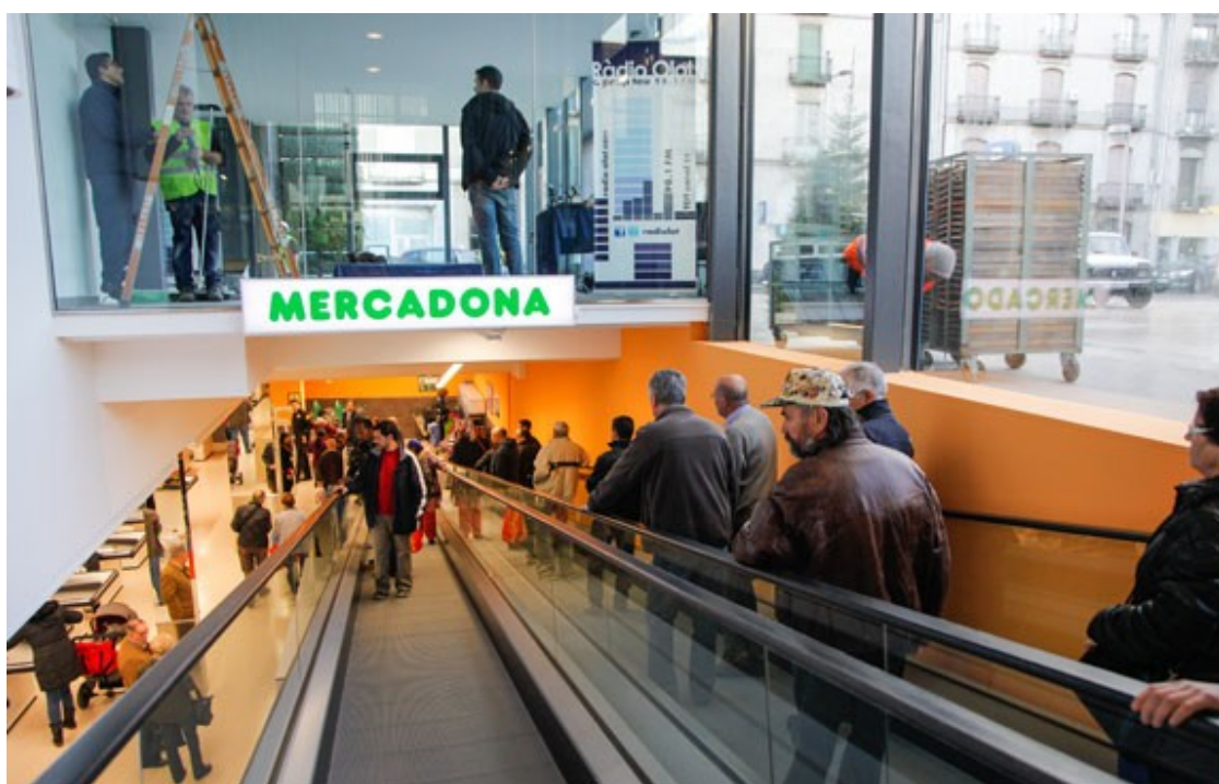
Inauguració del Mercadona a Olot.

Deu associacions, entre les quals totes les de botiguers menys la de Ripoll, signen un manifest en la qual s'insta a les administracions a aturar el nou supermercat de la Devesa del Pla