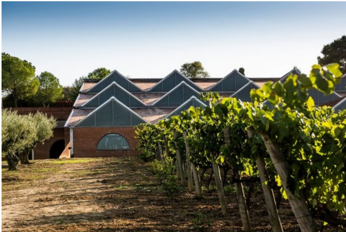
Raventós i Blanc