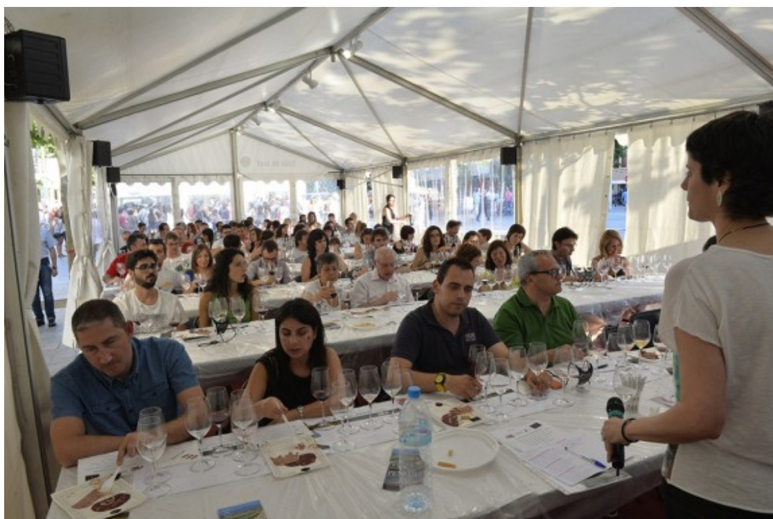
Tastos al Vijazz

Per la seva banda, el comitè científic dels 'Vins Vinents. Debat i reflexió estratègica per al futur de la vinya i el vi a Catalunya' ha decidit ajornar les jornades monogràfiques previstes pels mesos d'abril i maig, així com la jornada final de presentació de conclusions que s'havia de celebrar el mes de juny. Les noves dates s'anunciaran quan es conegui com es durà a terme el desescalament del confinament i quan es pugui garantir la seguretat dels assistents. Al mateix temps, des del comitè científic s'ha considerat que la situació actual farà també que, en el marc de Vins Vinents, es puguin fer anàlisi i propostes per a la recuperació del sector després de la crisi sanitària. Mentrestant, continua actiu l'espai de participació online on es poden consultar les sessions que s'han dut a terme fins ara, i on hi ha documentació sobre els grups de treball i també s'hi poden fer propostes.