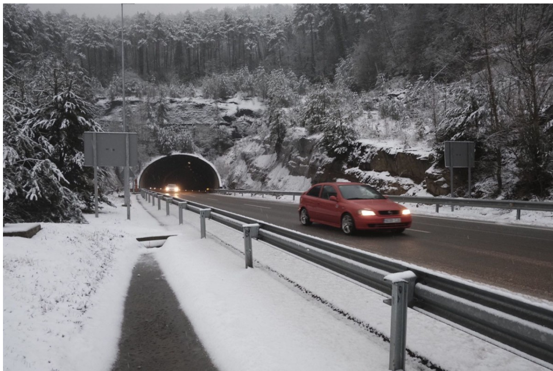
La C-17, una de les carreteres on pot nevar | Adrià Costa

La cota de neu pot baixar per sota dels 500 metres aquesta tarda i allargar-se fins a la matinada