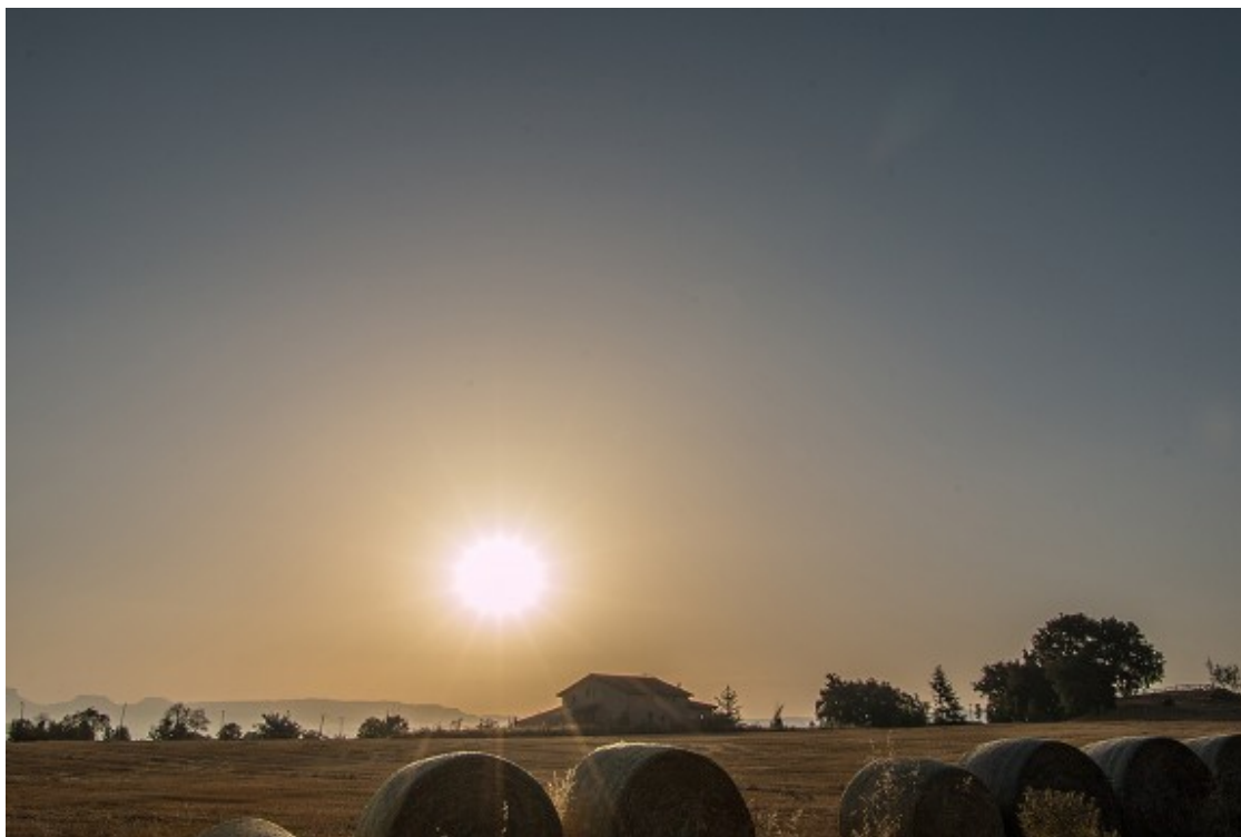
La sortida del sol aquest dijous, a Gurb

El risc d'incendi continua sent molt alt a una vintena de comarques