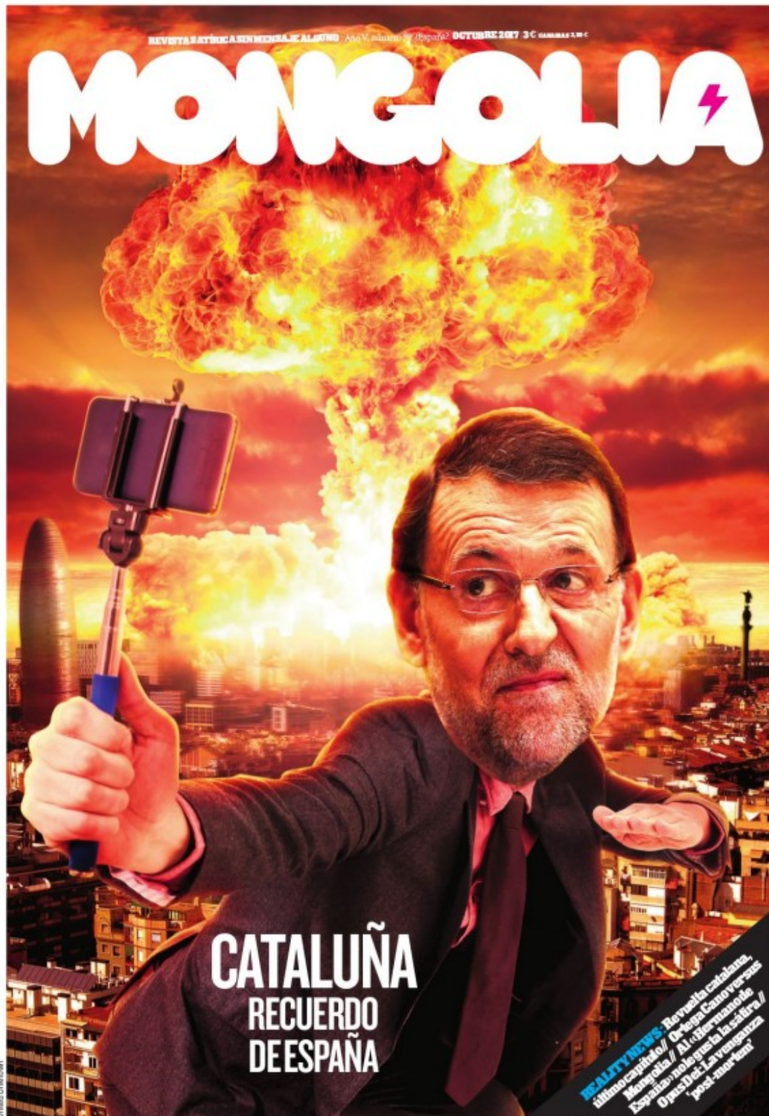
Portada de la revista "Mongolia"