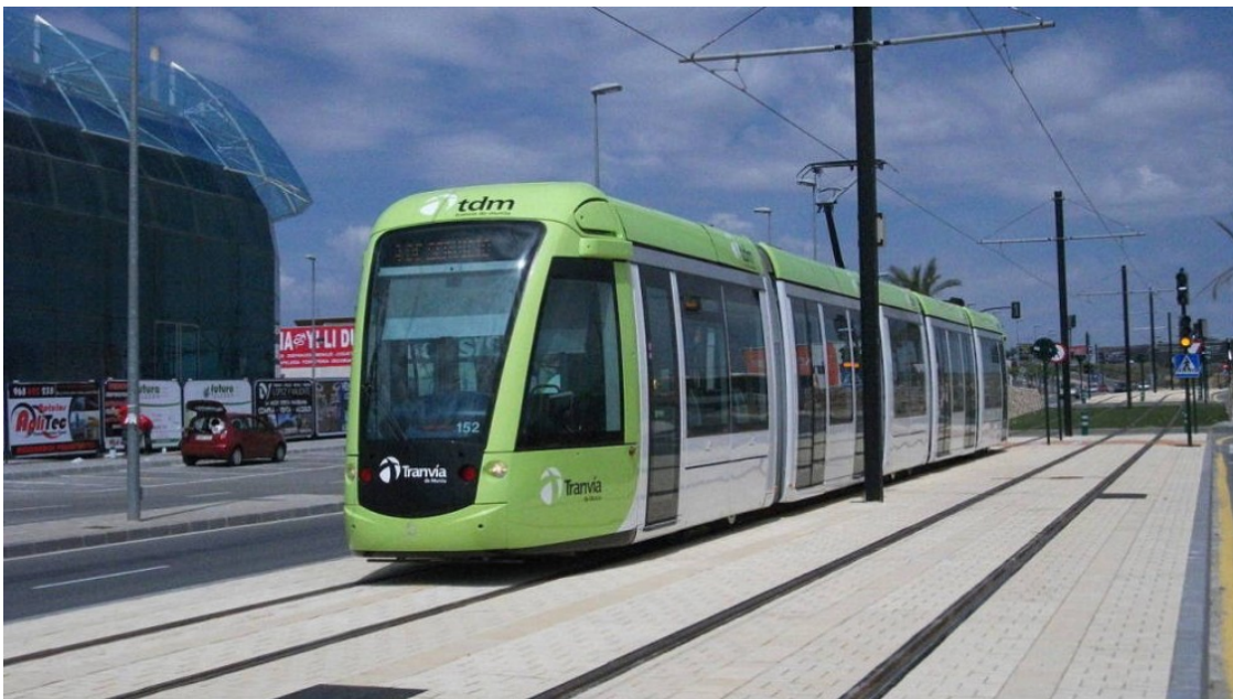
Imatge d'un tramvia de Múrcia

El noi va empaperar els carrers de Múrcia amb la intenció de trobar la jove que havia vist de nit i que no li va fer cas