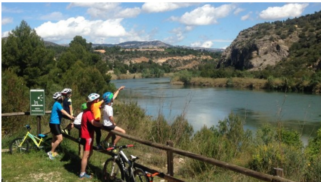
Cicloturistes fent una ruta per les Terres de l'Ebre

Amb les reserves registrades per l'Associació de Turisme Rural de les Terres de l'Ebre (Aturebre), les cases de pagès del delta de l'Ebre -i pràcticament també les de l'interior- podran penjar el cartell de complet entre Dijous Sant i Dilluns de Pasqua. La primera part de la setmana, però, només preveuen omplir la meitat de les places.