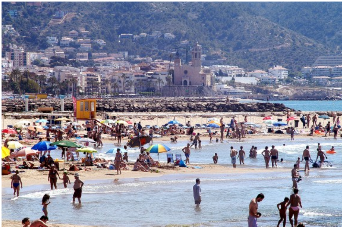
Turistes a Sitges, en una imatge d'arxiu.

El sector turístic català celebra que aquest any el període de vacances arribi ben entrada la primavera perquè les altes temperatures afavoreixen les reserves. A més, les darreres nevades garanteixen un bon estat de les pistes d'esquí de les comarques de Lleida i Girona. De mitjana, a hores d'ara les reserves als allotjaments turístics van del 70 al 90% d'ocupació des de Divendres Sant fins Dilluns de Pasqua, tot i que alguns indrets del país com les zones turístiques de la demarcació de Lleida esperen assolir el 100% d'ocupació.