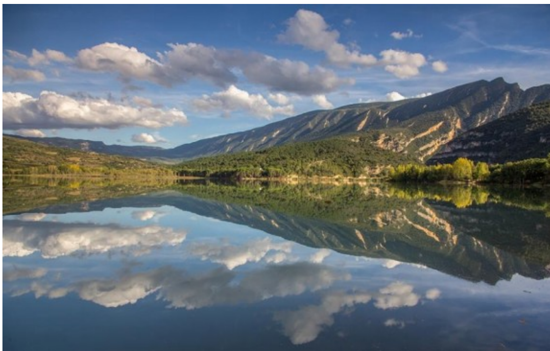
El pantà de Terradets, al sud del Pallars Jussà.

Els nivells d'ocupació per aquestes vacances de Setmana Santa variaran d'acord amb la tipologia dels establiments d'allotjament turístic, com també segons les diferents zones turístiques de la demarcació de Lleida. Les comarques del Pirineu seran les que tindran una millor ocupació turística, mentre que la procedència dels visitants serà majoritàriament de Catalunya, seguits dels del País Valencià, Madrid, l'estat espanyol i el sud de França.