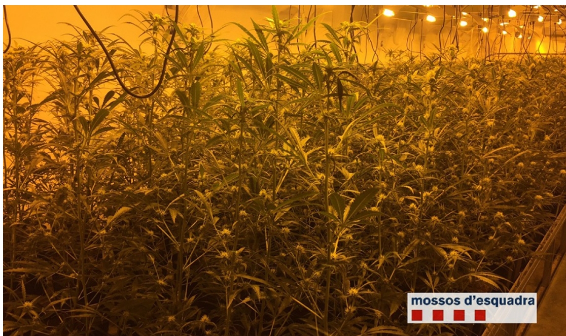
Plantació de marihuana a Avià

El nou cap dels Mossos al Berguedà explica l'inici de l'operació | Francesc Hernández assegura que una plantació de més de 3.000 plantes "no és tan habitual"