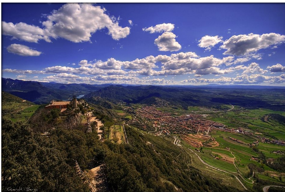
Queralt amb vistes a Berga.

Totes les activitats des divendres 26 d'agost a dijous 8 de setembre