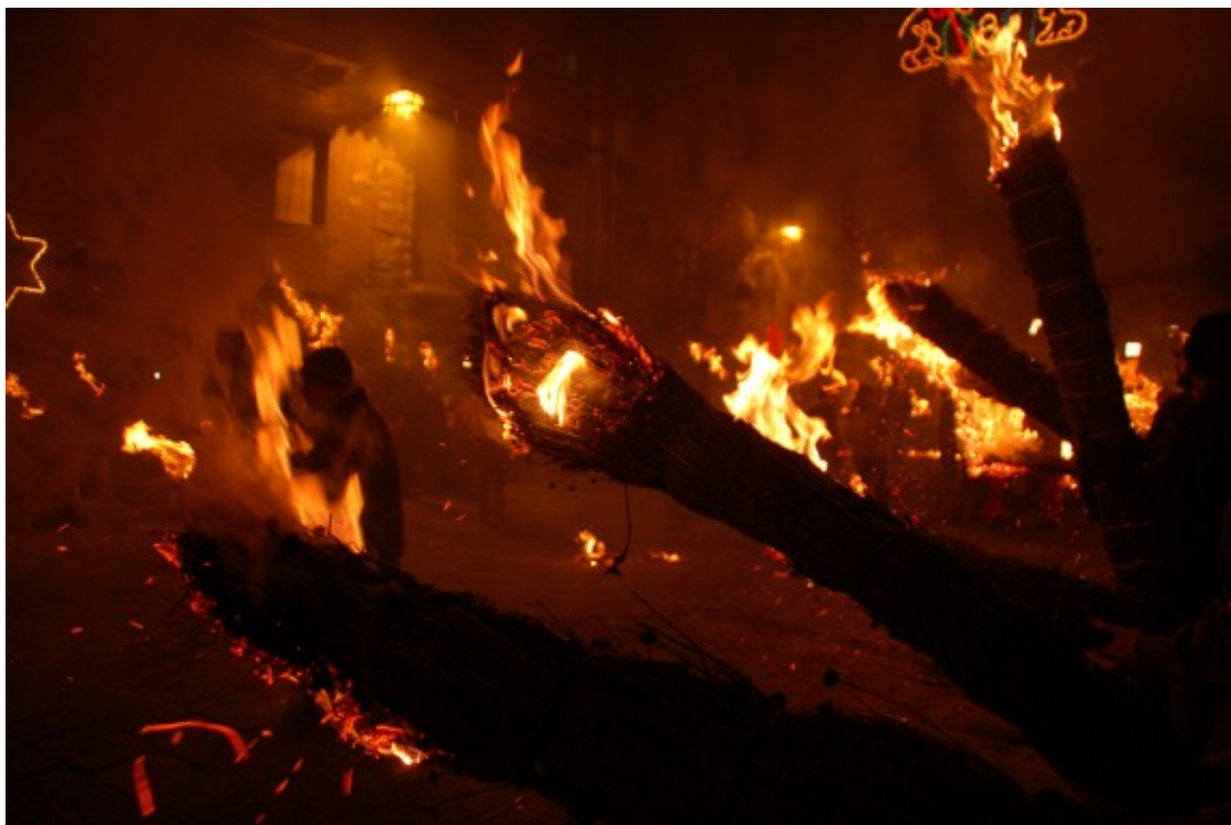
Fia-faia cremant a Bagà.