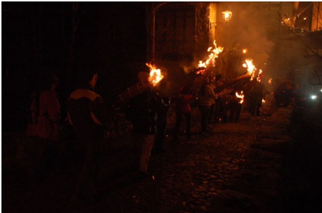
La Fia-faia de Bagà baixant del Siti.