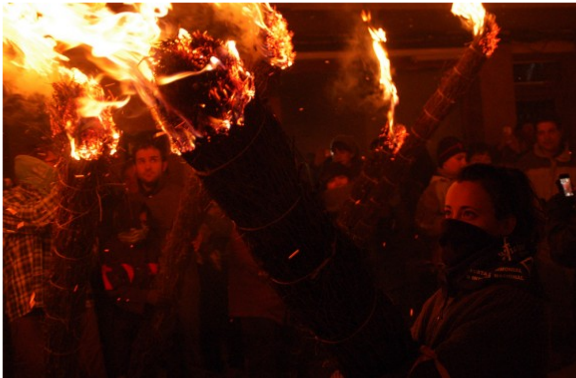
Fia-faia de Bagà. Foto: Aida Morales.

GALERIA DE FOTOS amb les millors imatges de la Fia-faia (Juli Bover) ( http://www.naciodigital.cat/naciobergueda/galeria/109/fia-faia/2015 )