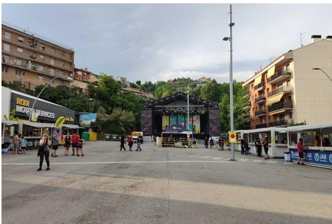
La plaça Cim d'Estela amb l'escenari i els mòduls per les entitats.

El concert de Cafè Trio es trasllada a la plaça Viladomat; Esperit de Vi, la Fúmiga i Thug Life tocaran al local dels Castellars de Berga