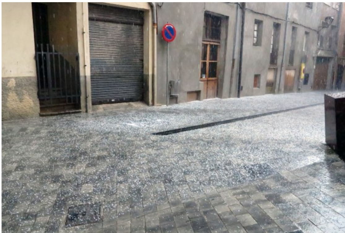
La calamarsa recobreix el terra de la plaça del Forn de Berga

V?deo: https://www.youtube.com/watch?v=l_b3ek_Huzs