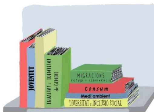
CONSELL COMARCAL DEL BERGUEDÀ