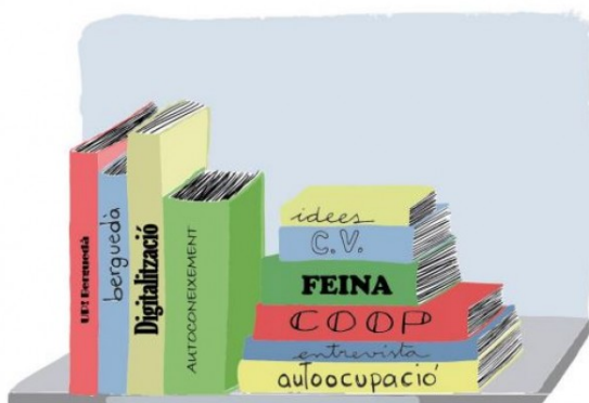
AGÈNCIA DE DESENVOLUPAMENT DEL BERGUEDÀ