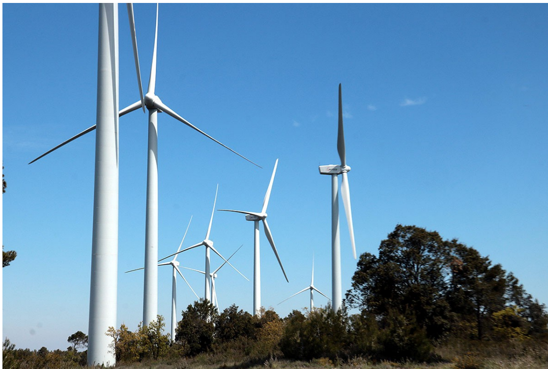
Parc eòlic de la serra de Vilobí | ACN

L'organització creu que se sobreestima el rebuig que poden generar les energies netes