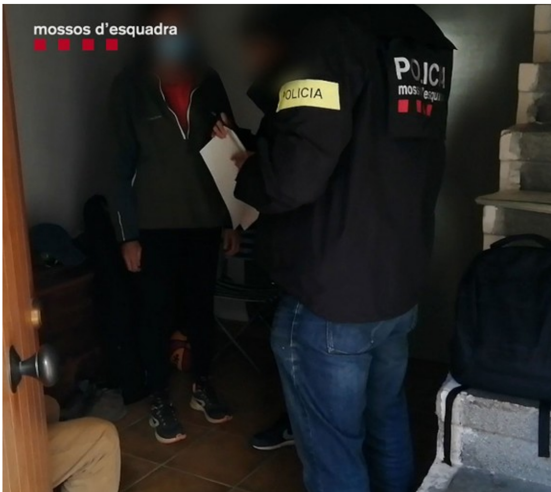
Operatiu policial contra el grup.

L'home s'atribuïa coneixements i capacitats per fer créixer espiritualment i emocional les víctimes, a qui denominava "alumnes". Es guanyava la seva confiança i n'obtenia tot tipus d'informacions que posteriorment emprava per a manipular-les psicològicament, arribant a exercir un gran control sobre diverses esferes de la seva vida. Les víctimes pagaven per assistir a diferents tipus de sessions per obtenir nous coneixements, millorar el seu estat anímic i assolir la pretesa il·luminació. El líder del grup vivia dels pagaments que feien els membres captats per aquestes activitats.