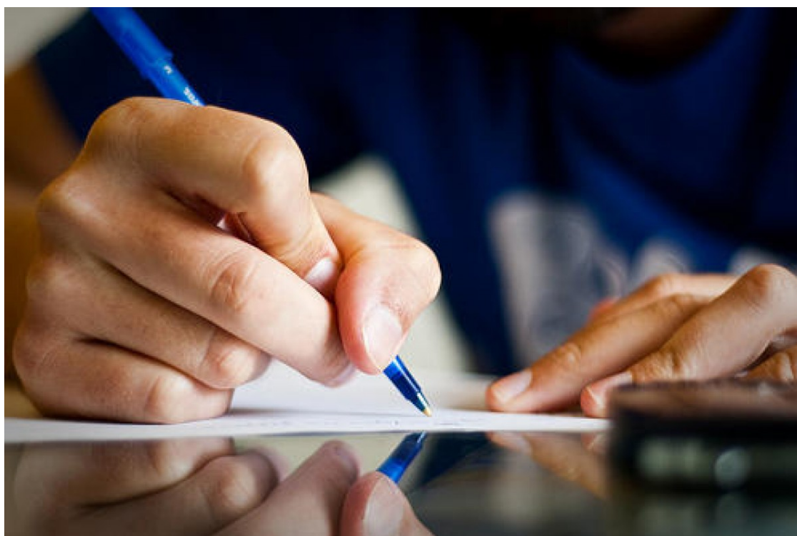
Recollida de signatures.

La iniciativa compta amb el suport d'una majoria de les associacions veïnals