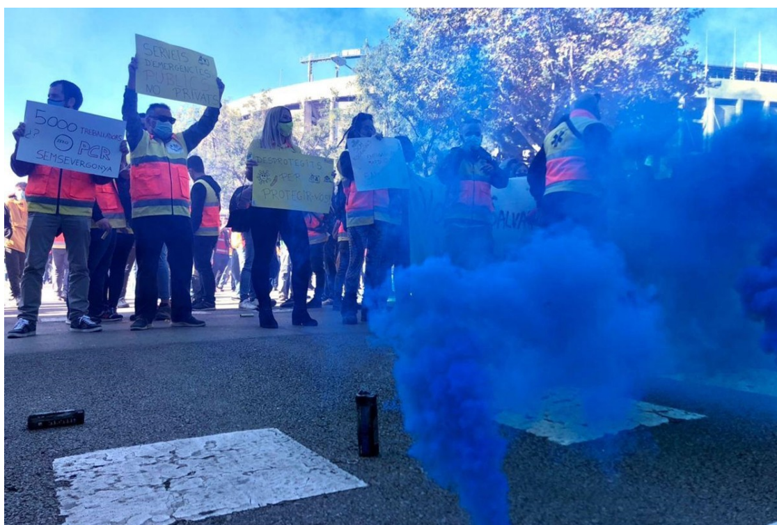
Treballadors del transport sanitari durant una protesta

Empleats sense afiliació i sindicats anarquistes, alternatius i locals doten de contingut una convocatòria que els majoritaris van fer a contracor