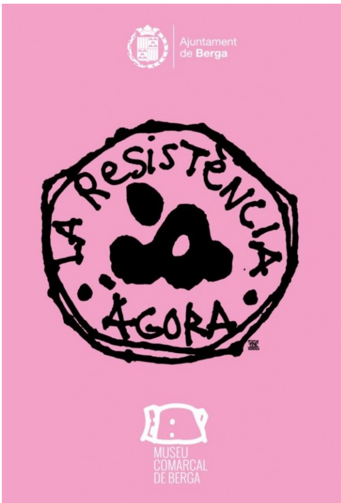
Cartell de la iniciativa 'Àgora. La resistència'.