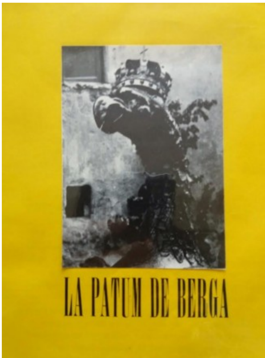
Portada de la publicació de de Martín a la revista 'Dau al Set'.