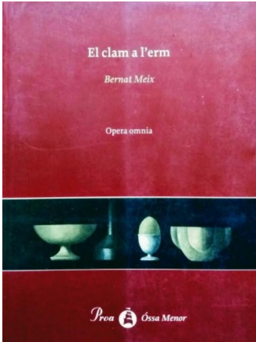
Portada del llibre 'El clam a l'erm'.