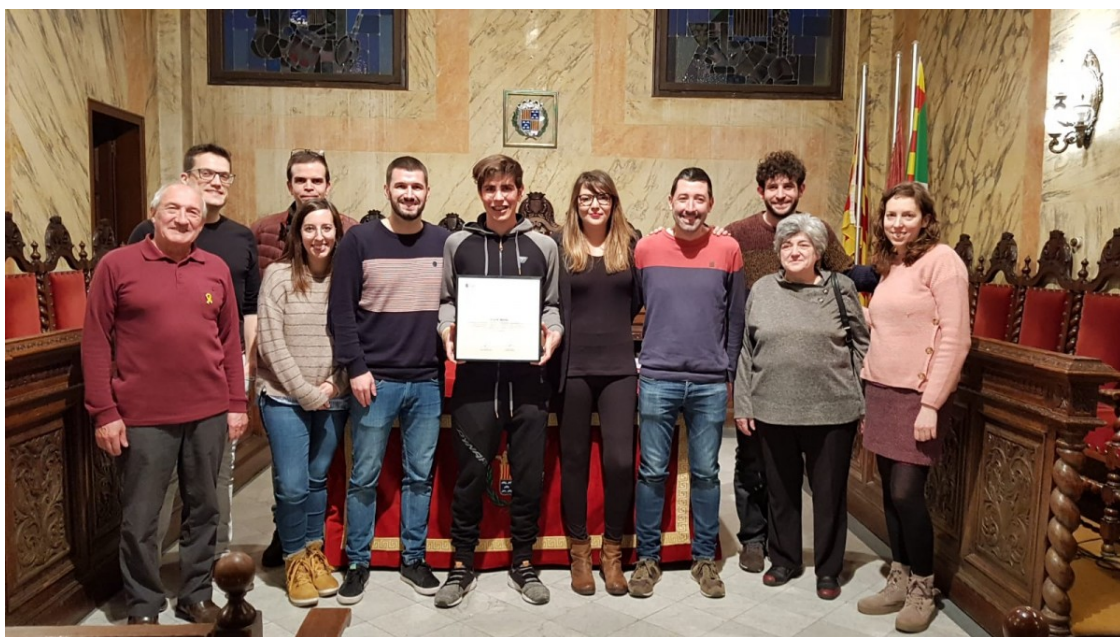
Ot Ferrer amb l'alcalde i els regidors de l'Ajuntament de Berga.

L'esportista berguedà ha estat obsequiat amb un diploma de reconeixement i ha signat el Llibre d'Honor de l'Ajuntament de Berga