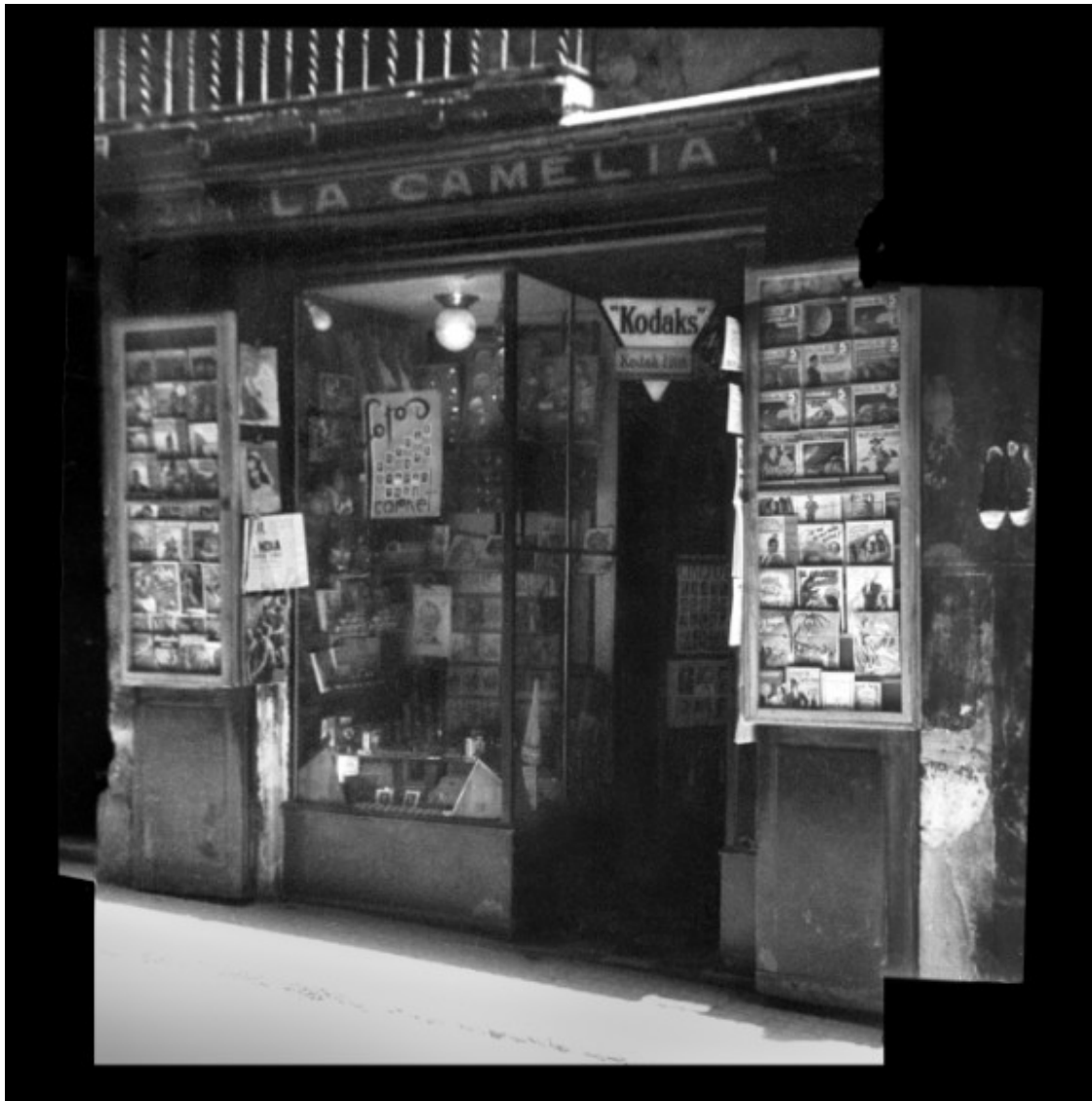
La botiga la Camèlia, precedent de Cal Luigi al Carrer Major de Berga, l'agost de 1947.