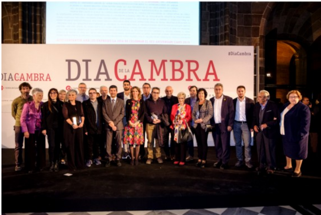
Empreses premiades per la Cambra de Comerç la passada tardor pels seus 50, 75 o 100 anys d'història.

"És una manera de buscar continuïtat sense haver de tancar, ja tenim algun festejador, però no hem concretat res encara. Jo he arribat als 65 anys i el meu cosí en té 63, així que hem vist que hem d'anar pensant-hi i aquestes coses s'han de fer amb temps, no es poden fer de pressa perquè si no les fas malament", conclou Escobet.