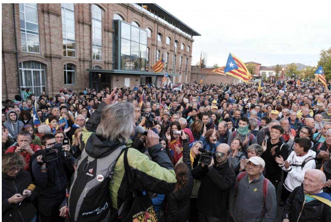
Sortida de la Marxa per la Llibertat a Vic

Milers de persones inicien una caminada de tres dies inèdita per protestar contra la sentència del Tribunal Suprem