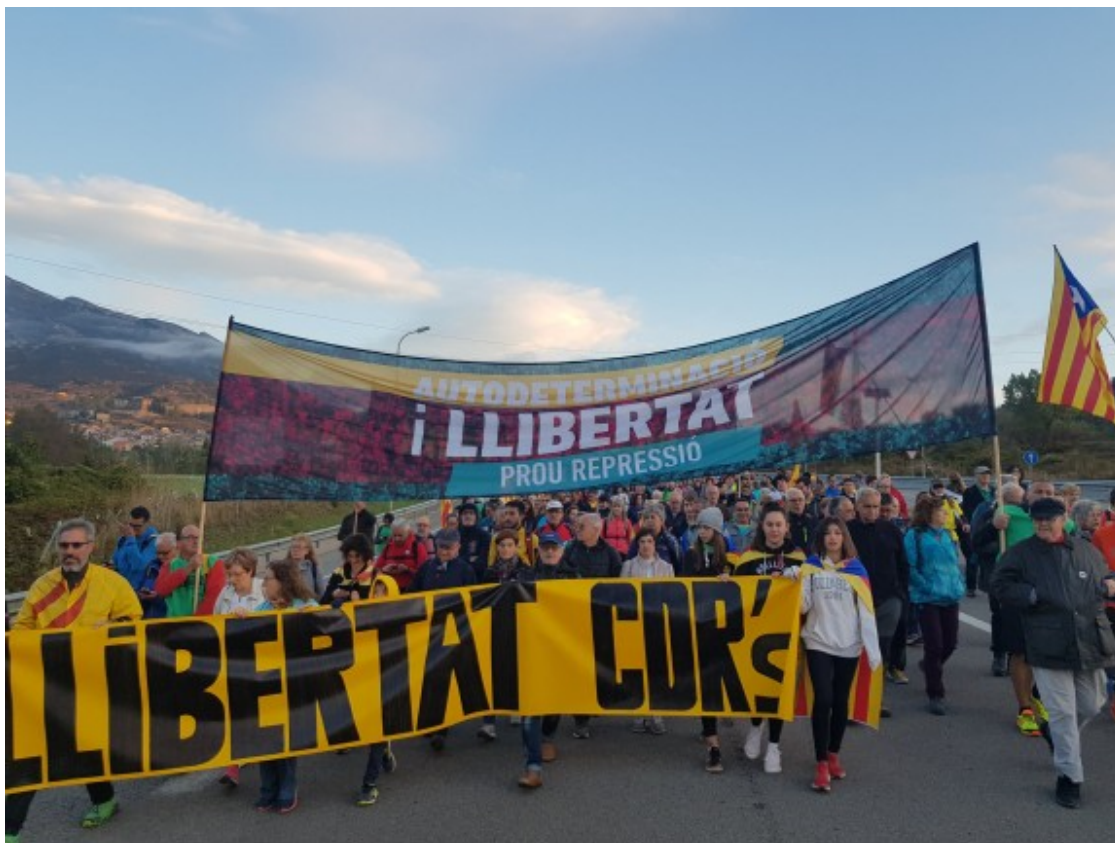
Marxa per la Llibertat a Berga.

A Girona, unes 7.000 persones s'han trobat a les 8 a la plaça U d'octubre i han sortit passades les 9, després d'esmorzar. A la capçalera hi ha familiars de Dolors Bassa i de Carles Puigdemont, així com la presidenta de l'ANC, Elisenda Paluzié. Els manifestants porten motxilles i estelades. També hi ha tractors a la marxa, que s'encamina a bon ritme cap a l'AP-7.