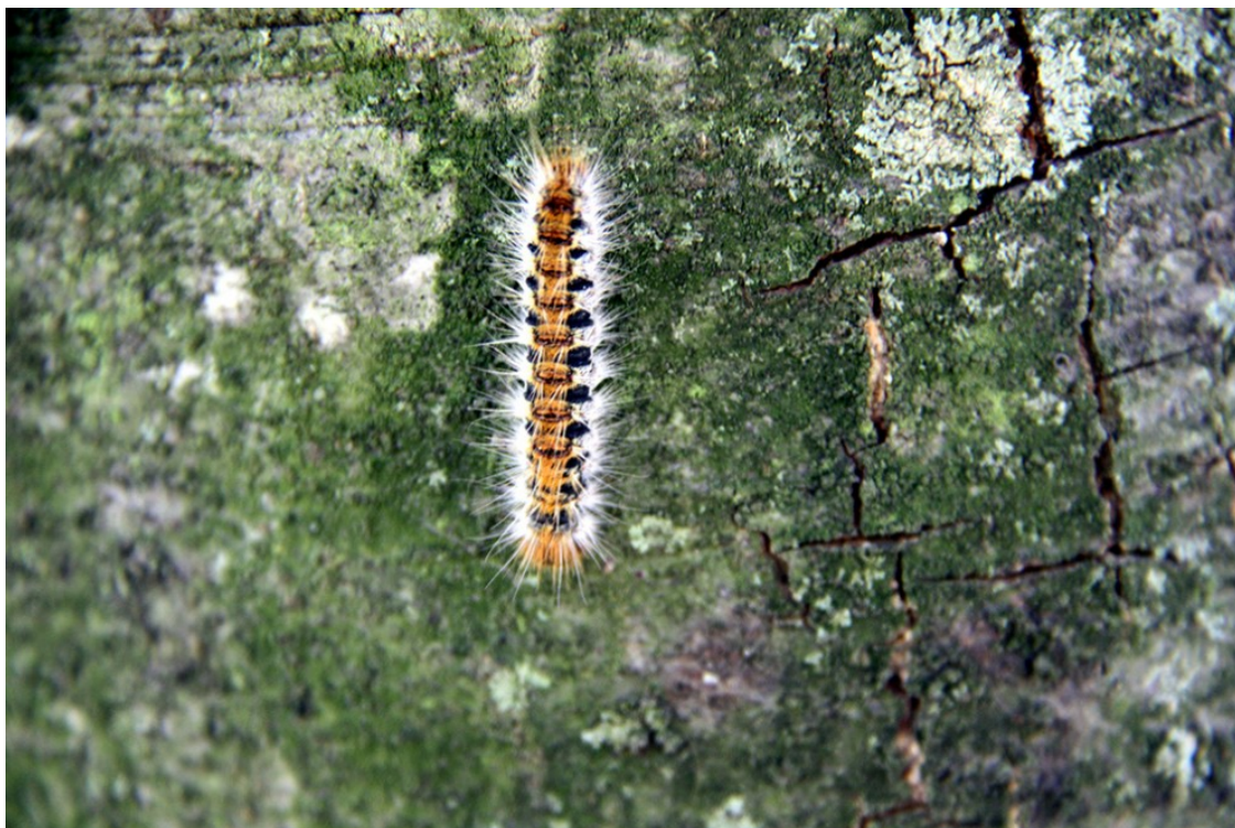
Eruga de la processionària a l'Espunyola.

El departament d'Agricultura actuarà a partir de dilluns sobre 17.500 hectàrees en prop d'una cinquantena de municipis de 12 comarques mitjançant tractaments aeris