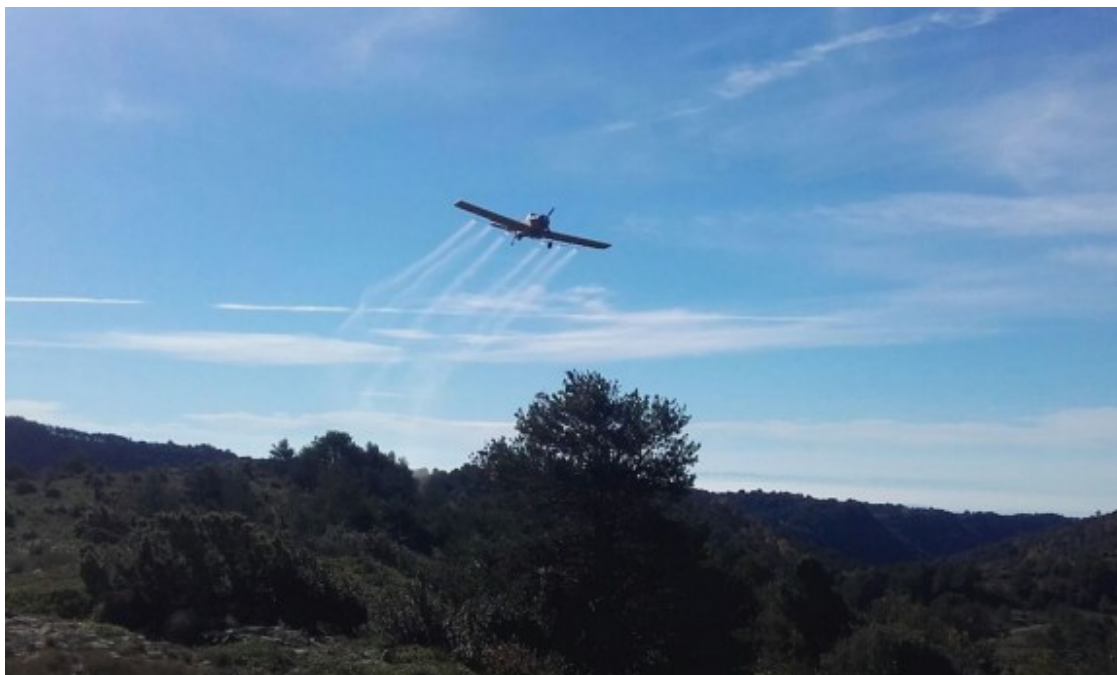
Una avioneta en ple tractament de la processionària l'octubre de l'any passat.

El tractament més efectiu per a combatre la processionària en l'àmbit forestal és l'aeri que es realitza a la tardor, en els primers estadis de desenvolupament de les erugues.