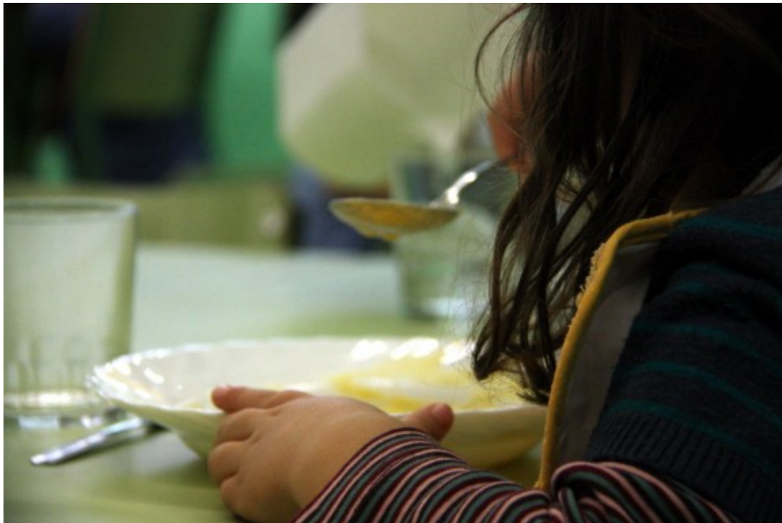
Una nena en un menjador escolar

Cambray explica que valoraran la proposta: "Hem de tenir indicadors qualitatius i quantitius". El director general de centres públics referma la voluntat del Govern de prendre decisions consensuades amb tot el territori, valorant la sostenibilitat del projecte i respectant l'autonomia dels centres.