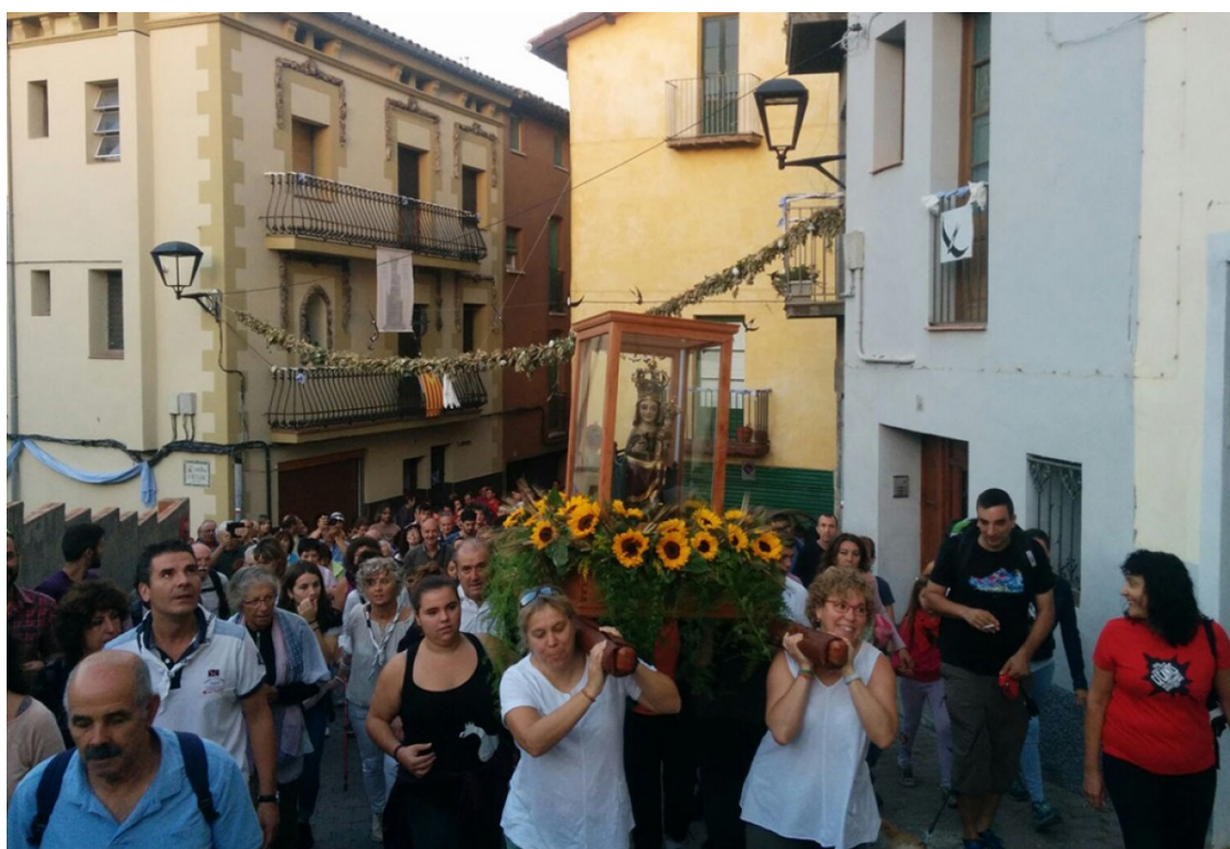
Els berguedans portant la Mare de Déu de Queralt cap al santuari l'any 2016.