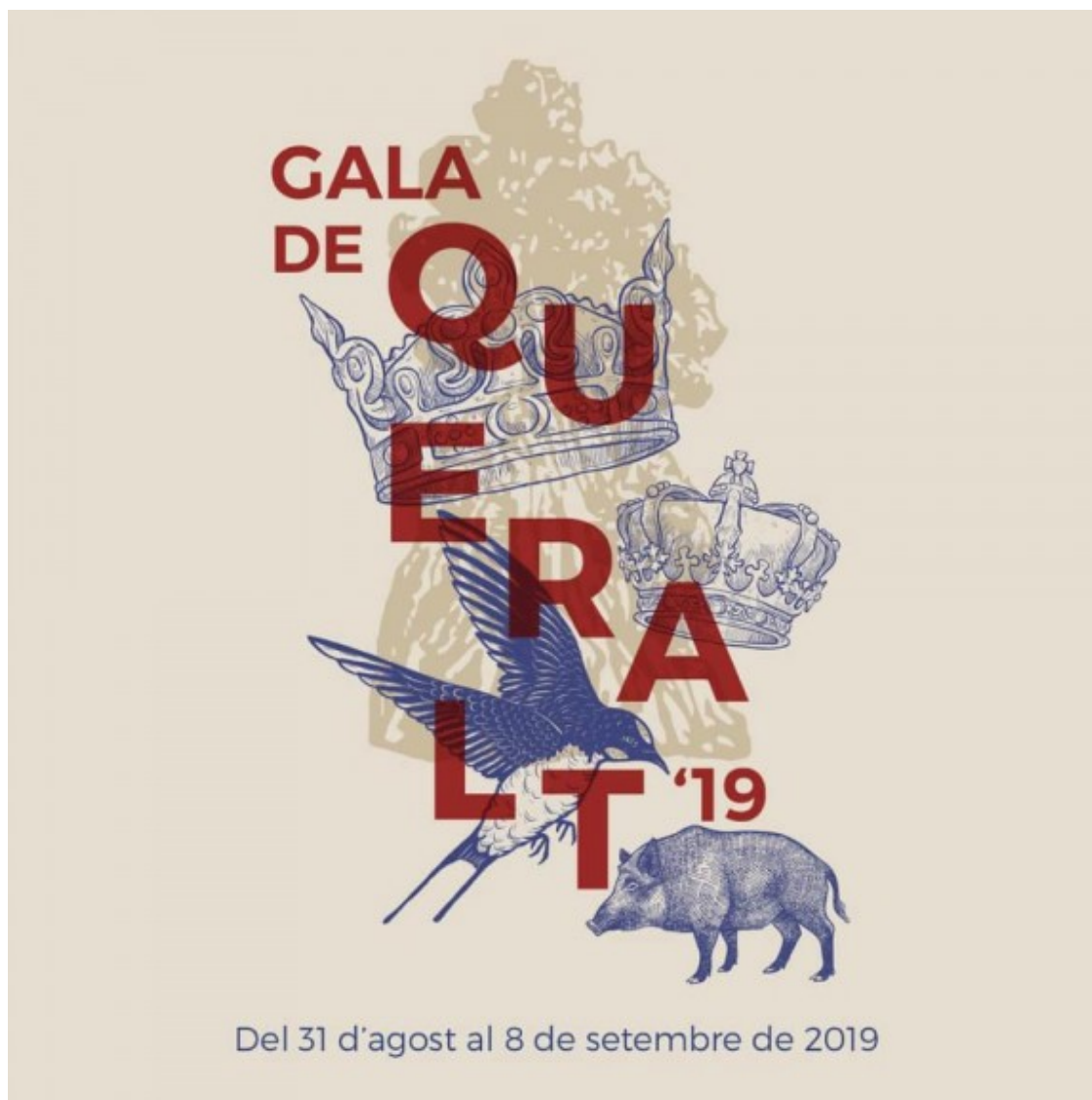
Cartell de la Gala de Queralt d'enguany.

Un any més, per cloure la jornada, hi haurà una nova edició de la gala d'estels amb observacions del cel i un sopar de carmanyola al santuari.