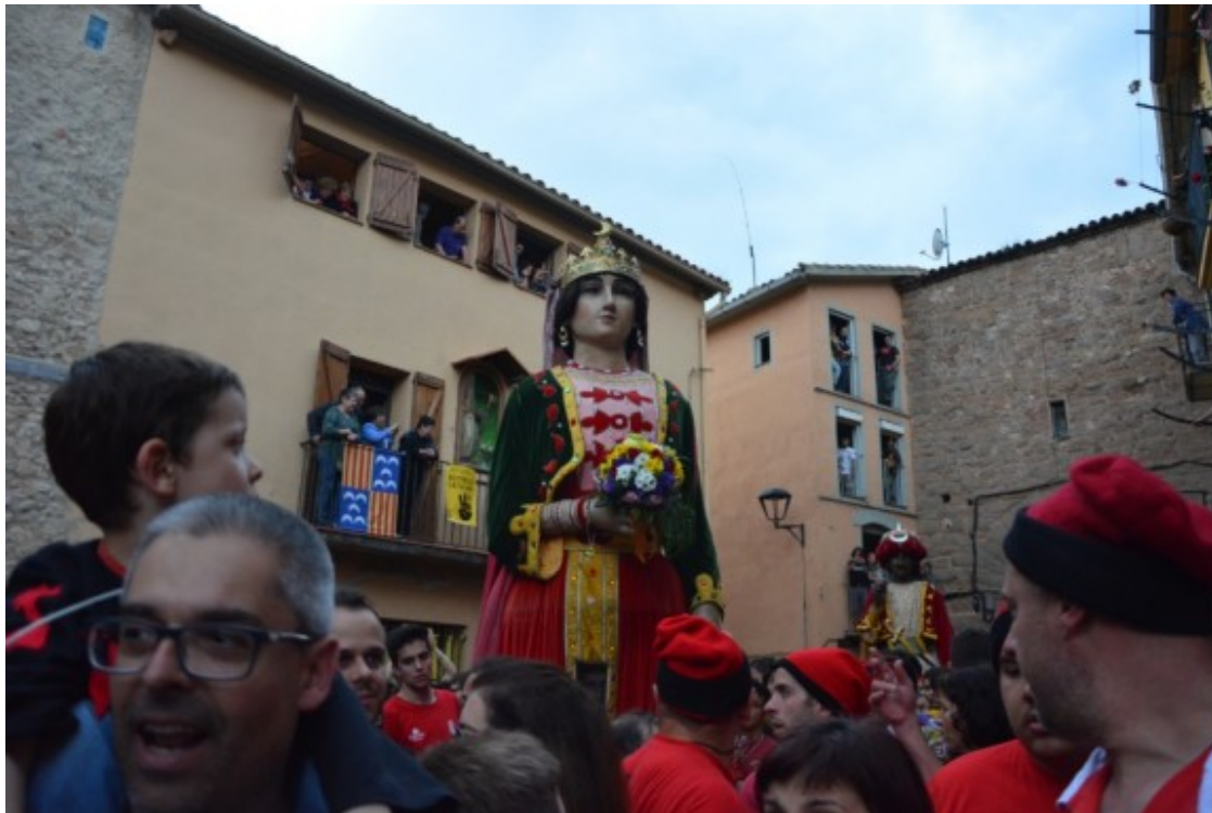
Passacarrers de dissabte.

Dijous i diumenge la Patum se celebra a la plaça de Sant Pere. Aquesta esdevé el centre neuràlgic de la festa. Al migdia hi ha Patum de Lluïment, una representació amb un caràcter d'exhibició i solemnitat en la qual la gent contempla les evolucions de les diferents comparses. L'actuació és successiva i sempre en el mateix ordre: els Turcs i Cavallets, les Maces i els Àngels, les Guites, l'Àliga, els Nans Vells, els Gegants i els Nans Nous, i per acabar, hi ha Tirabols