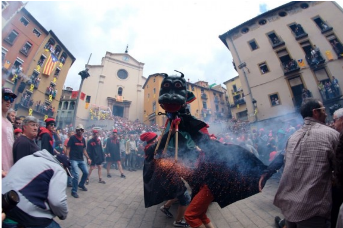
Les espurnes i la pólvora de les Guites sempre són protagonistes.