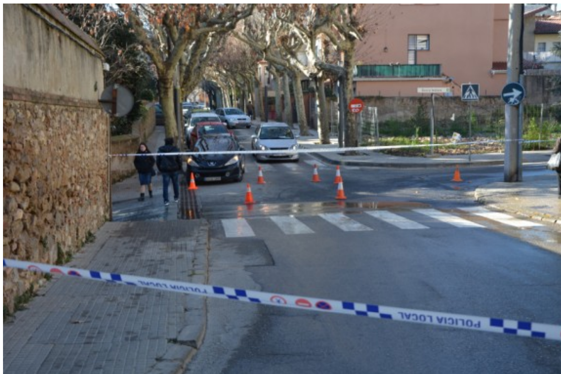
Afectació al carrer de les Estaselles.