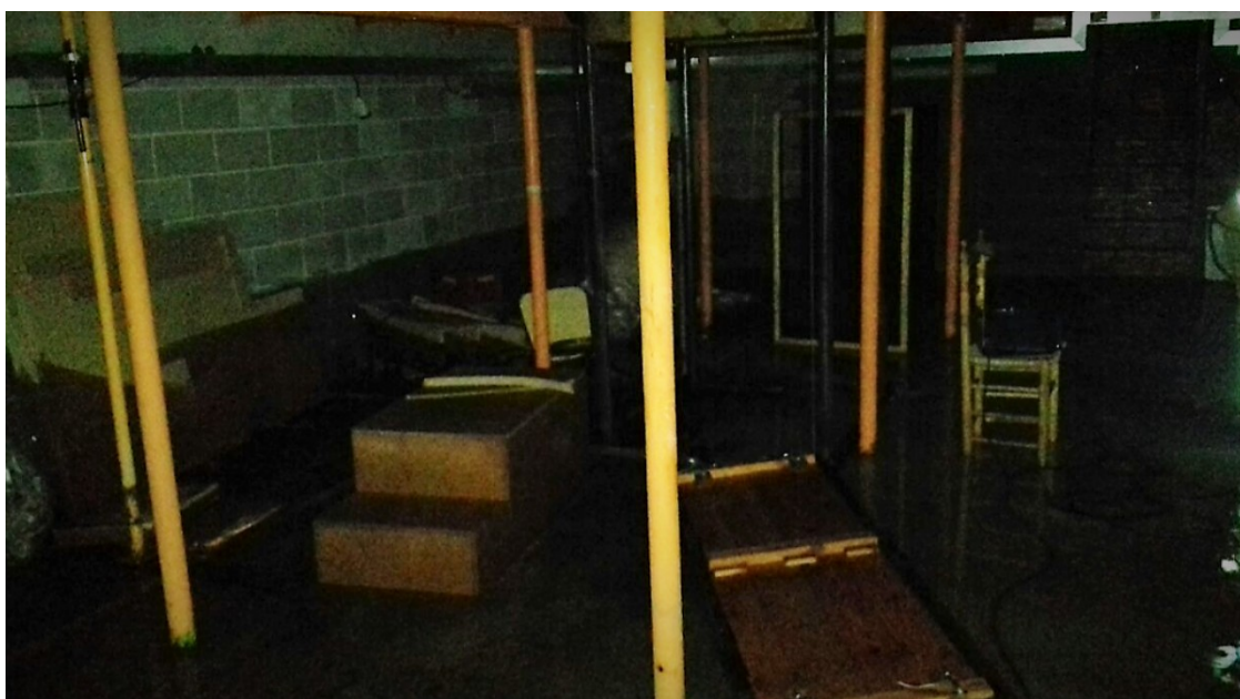
Escenari del Teatre Municipal de Berga. | Pilar Màrquez Ambrós

L'ajuntament es troba a l'espera una avaluació completa dels danys però d'entrada perilla l'última de les funcions dels Pastorets de la Farsa que es preveia per diumenge | Els Bombers han extret uns 3.000 litres d'aigua de sota l'escenari