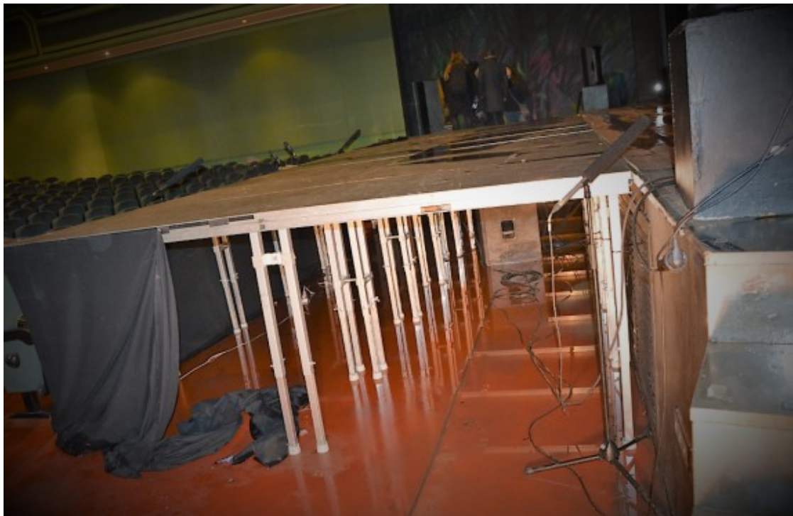
L'aigua ha afectat part de la platea i l'escenari.