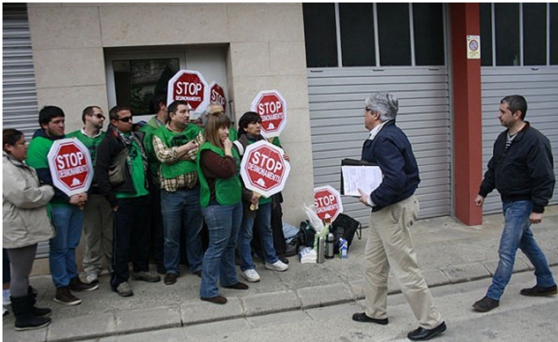
Un desnonament a Sant Pau de Segúries | Arnau Urgell

El Congrés endureix les clàusules per executar un contracte d'hipoteca