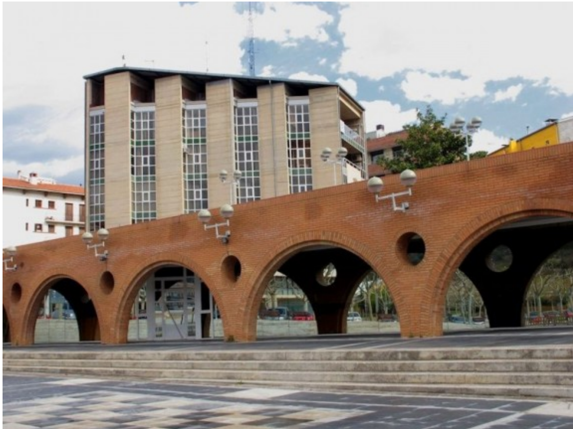
L'antiga Biblioteca de Puig-reig se situa a la plaça Nova, en ple centre urbà.

Segons Camps, "el que va passar és que no va sortir més d'un projecte, en va sortir un, però com que s'havia dit que les persones podrien participar de dues maneres diferents, o presentant un projecte i participant en aquesta primera fase o votant; no es va voler excloure la part de la població que havia de poder votar i el que s'ha fet és obrir un període d'esmenes al projecte consensuat".