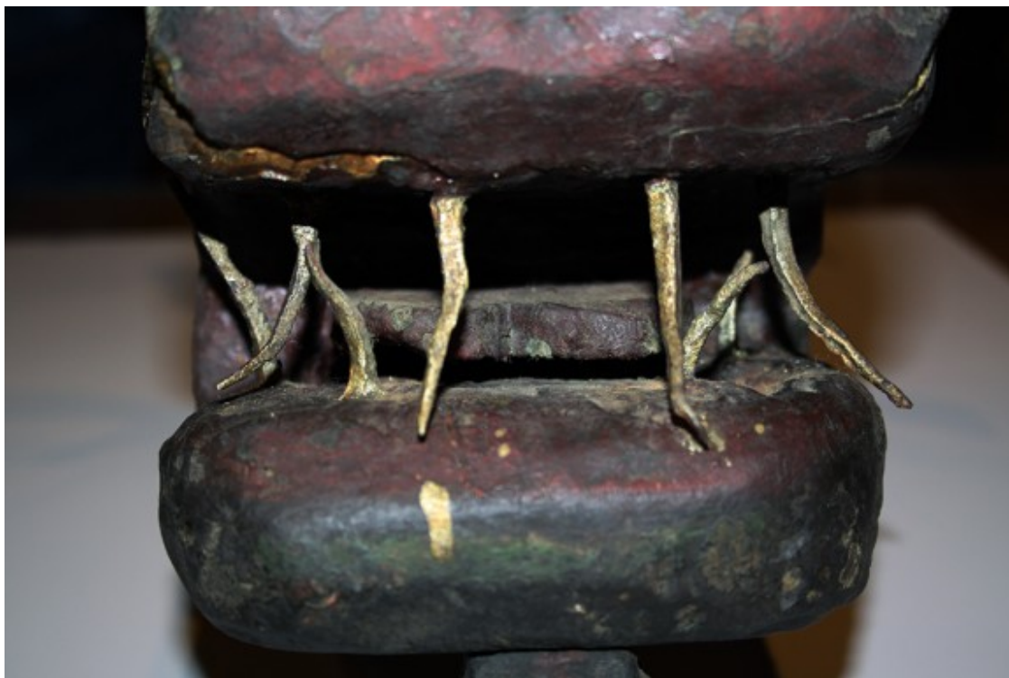
Detall de la boca de la Guita Xita