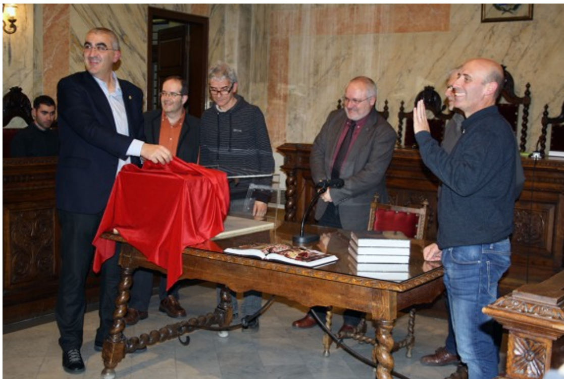
Moment de presentació al públic el cap autèntic de la Guita Xica