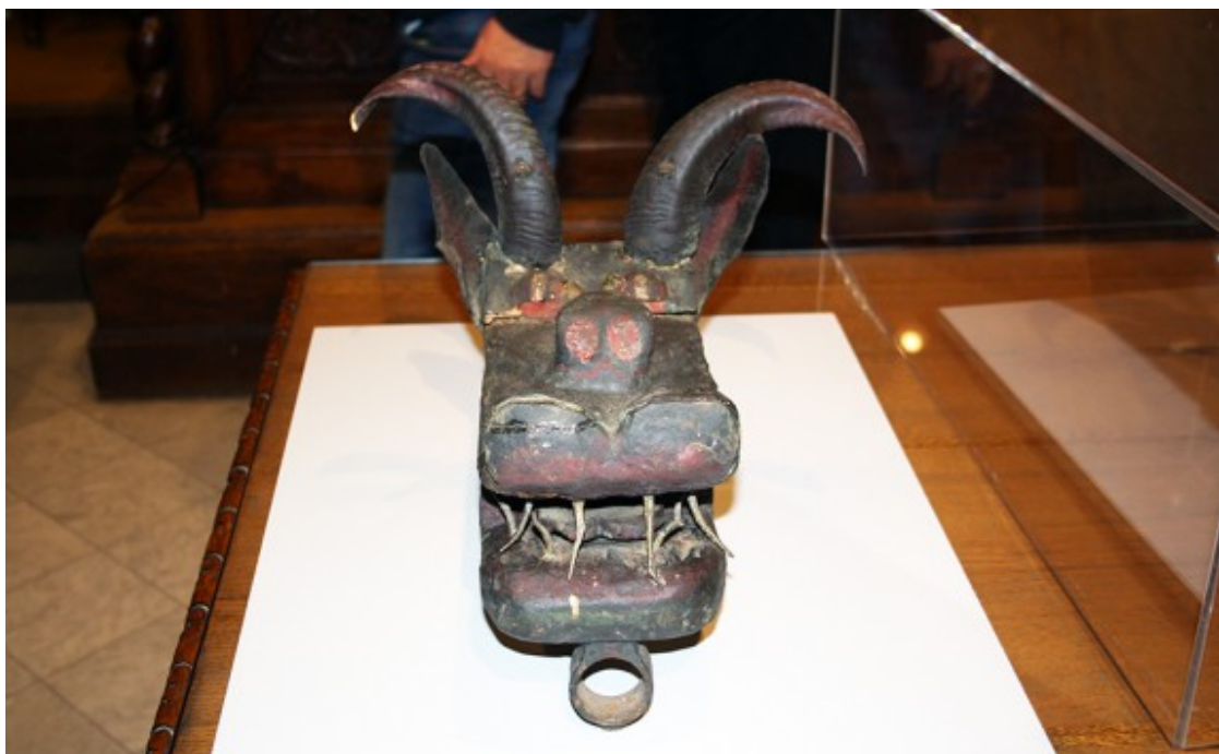
El cap original de la Guita Xica