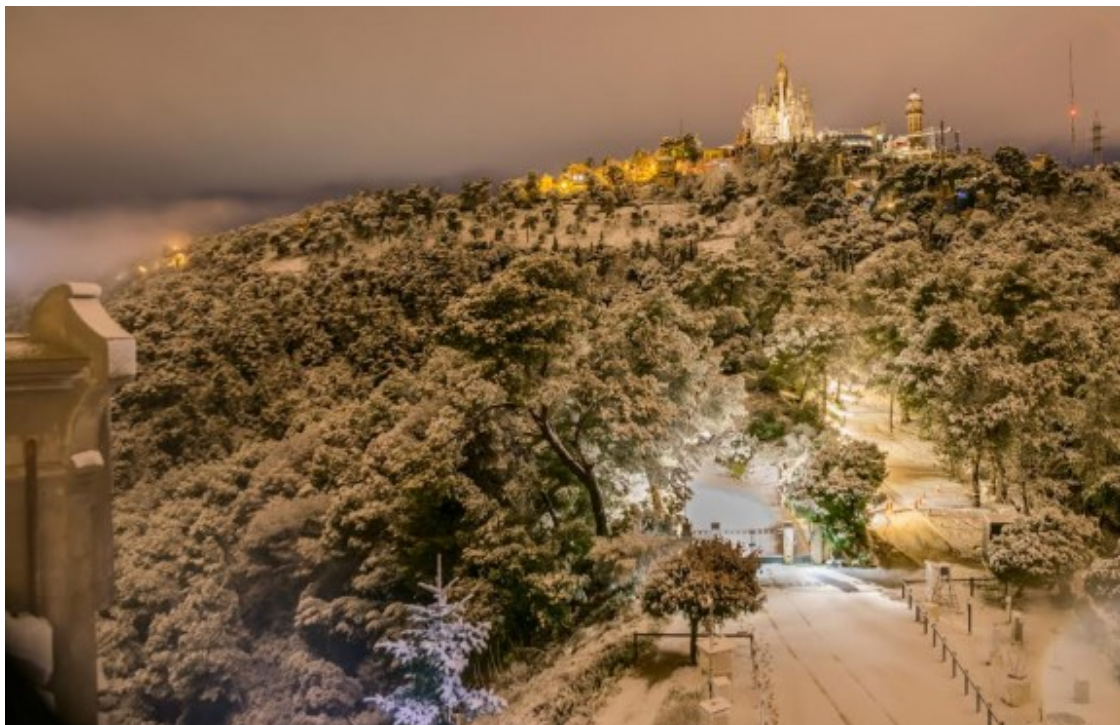
La neu pot tornar a arribar al Tibidabo la setmana que ve.

Els models a mitjà termini indiquen una forta baixada de la temperatura a tota Europa a partir de dilluns