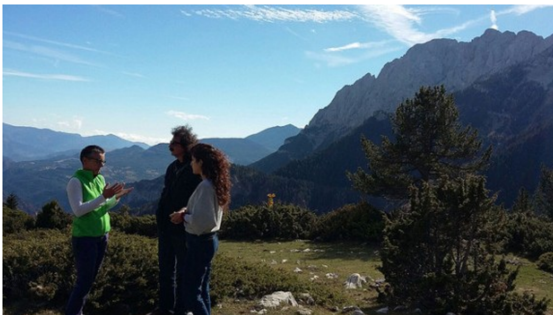
Membres de l'ADBerguedà explicant les particularitats del Pedraforca.

L'empresa ETAM estudia les muntanyes emblemàtiques del Mediterrani que formen part del projecte per crear eco-itineraris en comú entre totes elles