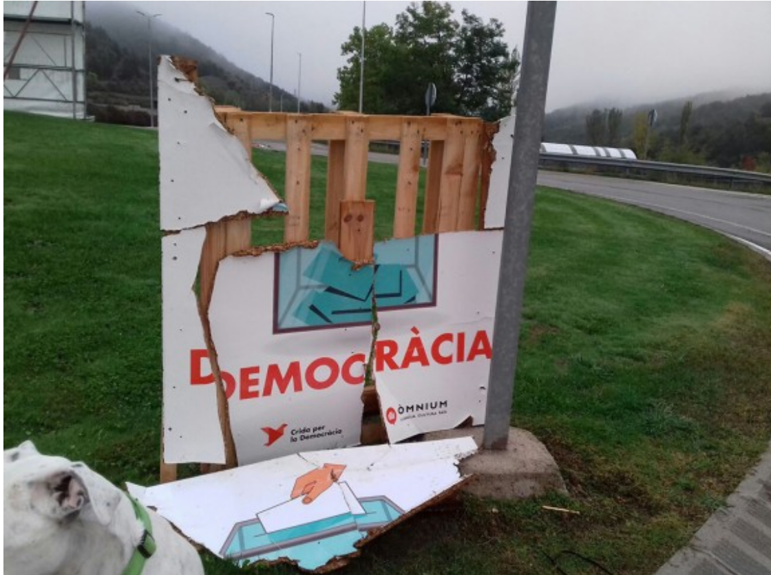
Cartell mig reconstruït a Bagà, l'última vegada que es va malmetre.

( http://www.naciodigital.cat/bergueda/noticia/10857/ajuntaments/psc/al/bergueda/reticents/hora/donar/suport/al/referendum ) . En aquest punt, en declaracions a NacióBerguedà va afirmar que "s'havia de trobar una solució política" que no comprometés funcionaris i personal del consistori ( http://www.naciodigital.cat/bergueda/noticia/10918/compromis/baga/denuncia/comentaris/ofensius/vexatoris/humiliants/alcalde/equip/govern ) , i va emplaçar la Generalitat i l'administració General de l'Estat a trobar-hi una solució.