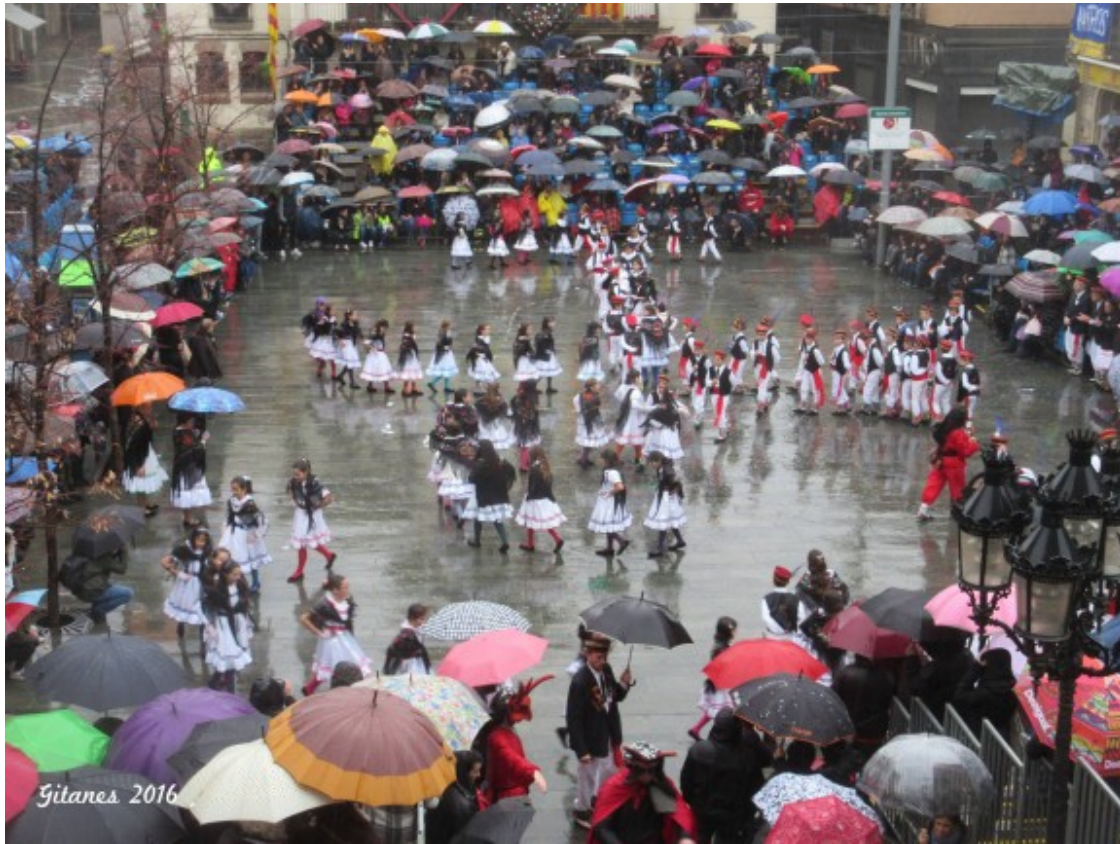
Ball de Gitanes a Sant Celoni sota la pluja.

Són sens dubte tres imatges d'avui diumenge al Baix Montseny. El genuí Ball de Gitanes de Sant Celoni que mai s'atura, malgrat la pluja que per fi ha caigut aquest matí i que segons que informen des de Meteo Suís durant l'estona que ha durat el ball s'han recollit 16 mm. La vicepresidenta del Govern de la Generalitat, Neus Munté, ha estat la convidada d'honor.