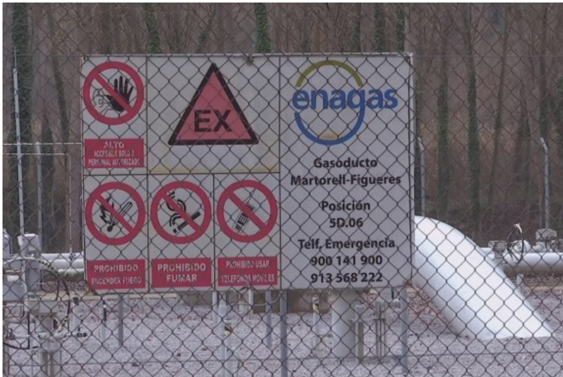
El cartell d'Enagás al recinte del gasoducte Midcat

Mentre el tècnic d'Enagás feineja pel recinte, el portaveu de la plataforma Resposta Midcat reflexiona, a peu de canonada, sobre les incongruències flagrants de les estratègies energètiques que s'estan posant sobre la taula en aquests moments. "De la dependència de Rússia , es passa a la dependència d'Algèria , que no té capacitat per subministrar a tot el nord d'Europa i que manté una relació inestable amb l'Estat". "Alemanya canvia Rússia per Qatar". "França ha dit que no li interessa el projecte i hi ha arguments que compartim, però no l'aposta per l' energia nuclear ".