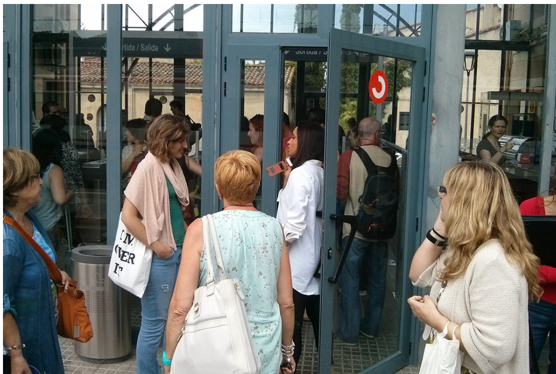
Estació de Renfe de Llinars del Vallès

L'actuació inclou la construcció d'un edicle per controlar i ordenar l'entrada a l'aparcament de l'estació