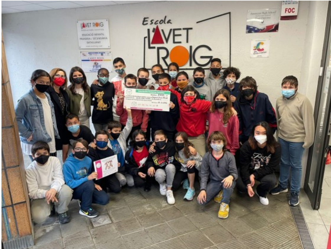
Tota la classe de 6è de primària a l'entrada de l'escola