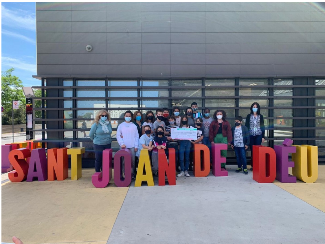
El grup d'alumnes de l'escola l'Avet Roig a l'Hospital Sant Joan de Déu | Avet Roig

La classe de 6è de primària ha lliurat els diners a l'Hospital Sant Joan de Déu gràcies a la venda de polseres