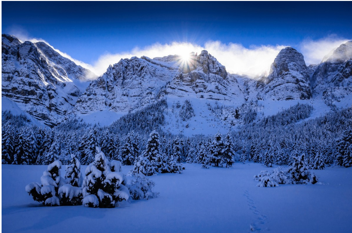
El Cadí Moixeró captat per Sergi Boixader | Sergi Boixader

Aquest dissabte 30 de novembre se celebra la trobada fotogràfica amb la presentació de dues exposicions sobre el Montseny i els Pirineus