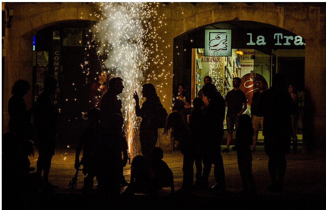
Revetlla de Sant Joan a la plaça Major de Vic | Adrià Costa

A partir del dia 25 es preveu que arribi la primera onada de calor de l'estiu