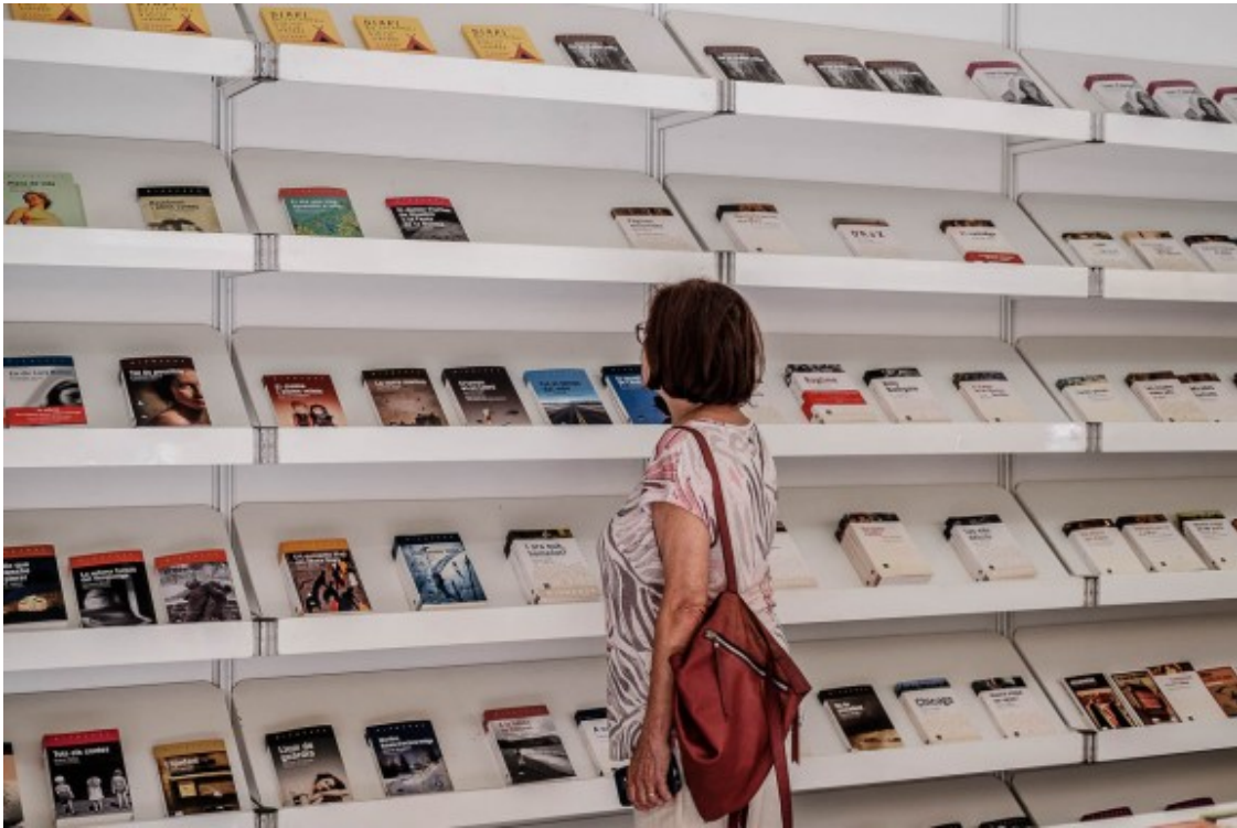
Una lectora en un stand de la Setmana del Llibre en Català.