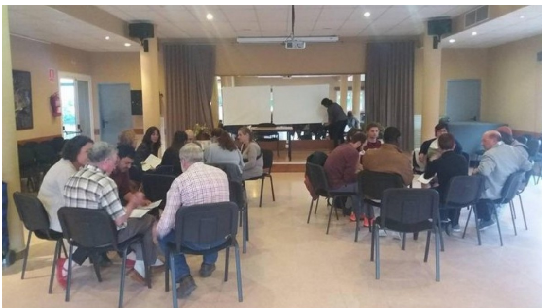
Un dels tallers participatius del futur POUM

En els tres tallers celebrats durant els mesos d'octubre i novembre els participants van crear grups de treball en els quals van extreure les seves pròpies conclusions en diferents aspectes del futur model urbanístic del municipi